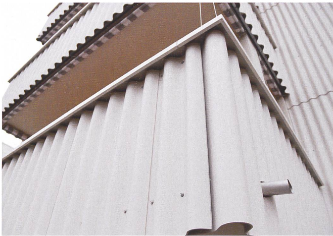
Nahaufnahme der Eternitverkleidung.