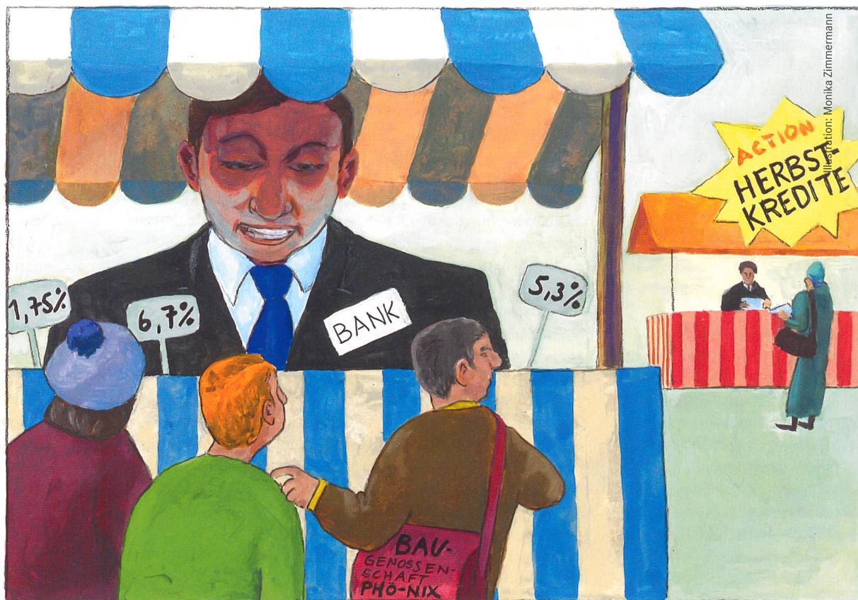
Illustration: Monika Zimmermann

Der Hypothekenmarkt scheint paradiesisch. Tiefe Zinsen seit Jahren. Doch gehen wir ins Detail, sieht man, dass der Markt auch Unsicherheiten birgt und Veränderungen aufziehen. Das Know-how auf diesem Gebiet zu pflegen, ist grundlegend für das Wirtschaften gemeinnütziger Bauträger.