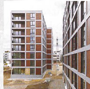
Wohnsiedlung Schaffhauserstrasse, Zürich