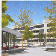
Wohnüberbauung Katzenbach II, Zürich