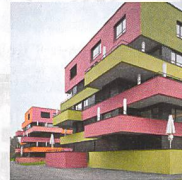
Wohnsiedlung Affoltern, Zürich