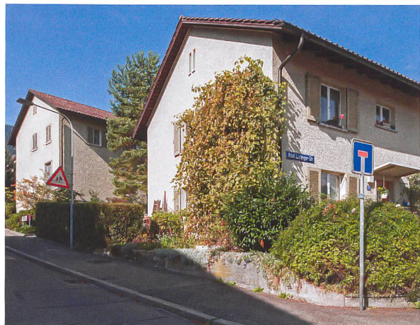
Zehn Etappen werden gemäss Masterplan bis 2050 ersetzt. Einige Siedlungen, darunter die 16. Etappe (im Bild), wurden neu als Schutzobjekte inventarisiert.

dass dort 1400 bis 1900 Menschen mehr als heute leben können. Da eine höhere Ausnutzung gemäss heutiger Zonierung nicht möglich ist, erarbeitet die Stadtverwaltung nun die erforderlichen Planungsinstrumente. Für die Neuplanung der Siedlungen sollen Wettbewerbe durchgeführt werden. Aber auch denkmalpflegerische Massnahmen wurden beschlossen: Siedlungen aus drei