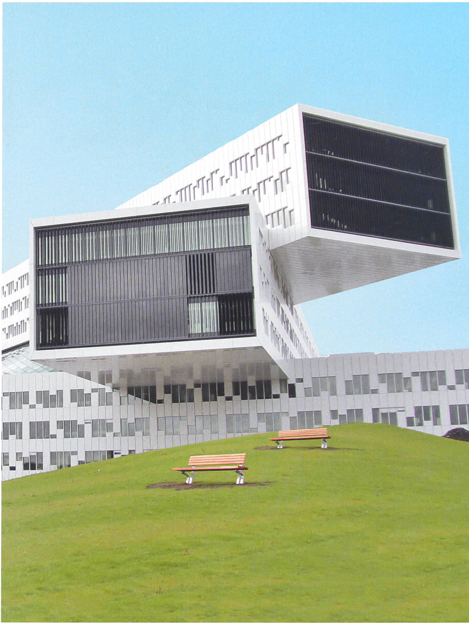
Statoil Headquarters, Oslo