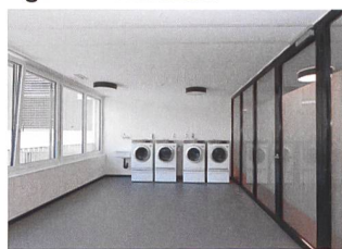
Jedes Stockwerk besitzt einen eigenen Wasorraum.