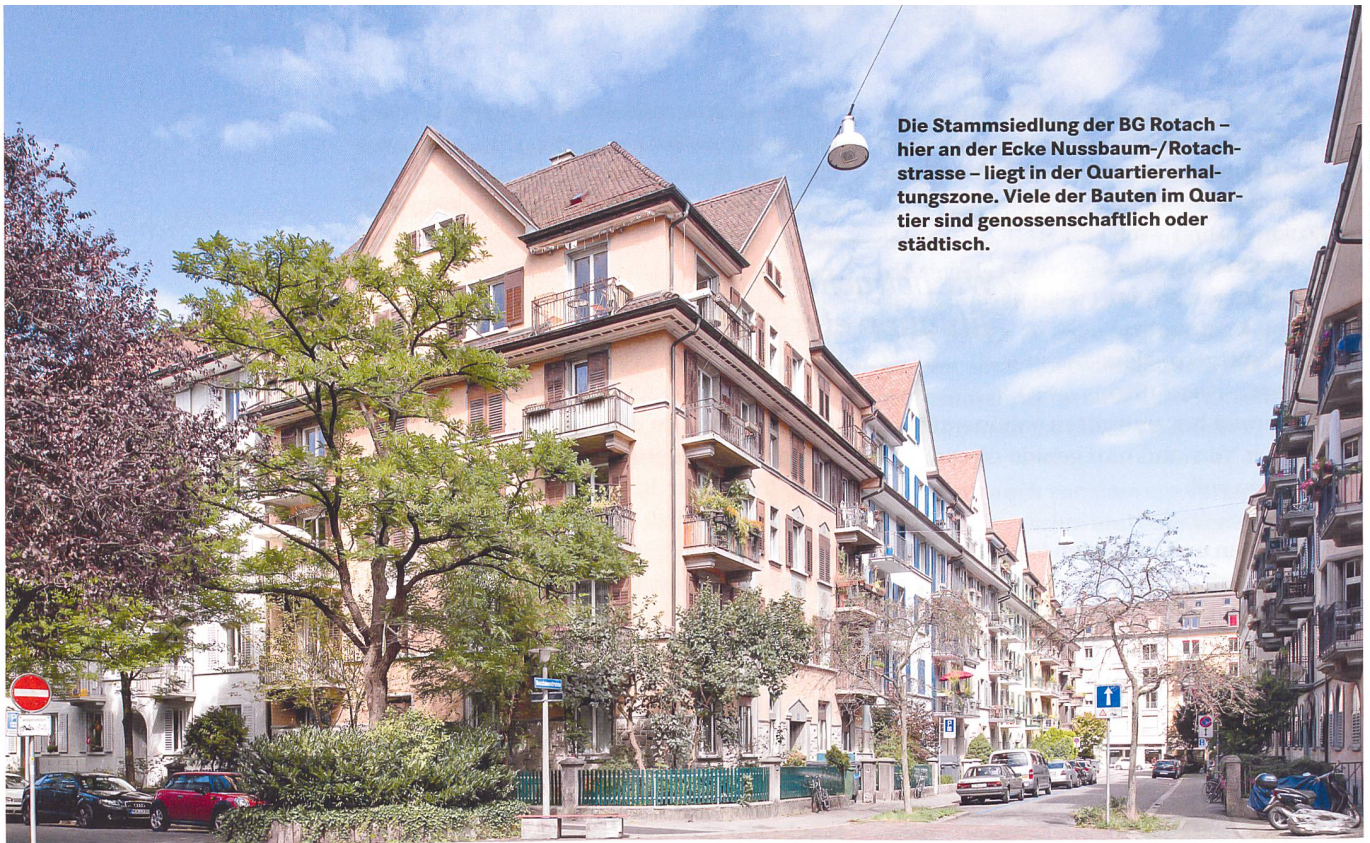
Die Stammsiedlung der BG Rotach – hier an der Ecke Nussbaum-/Rotachstrasse – liegt in der Quartiererhaltungszone. Viele der Bauten im Quartier sind genossenschaftlich oder städtisch.