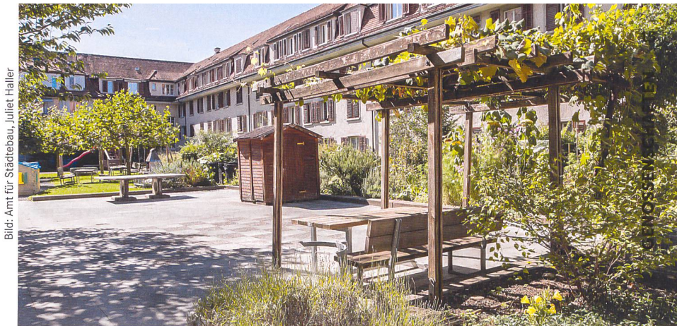
Die Innenhöfe im Rotachquartier sind unterschiedlich gestaltet, alle sind aber geschützt, begrünt und vielfältig nutzbar.

Die Arbeitsgruppe hat angesichts dieser kniffligen Ausgangslage bei der Strategieentwicklung für die Siedlung im Rotachquartier nach neuen Wegen gesucht. «Uns ging es darum, die Qualität des Bestehenden fassbar zu machen und zu überprüfen, welche Optionen zukunftsfähig sind. Was macht es aus, dass Wohnungen, die vor neunzig Jahren gebaut