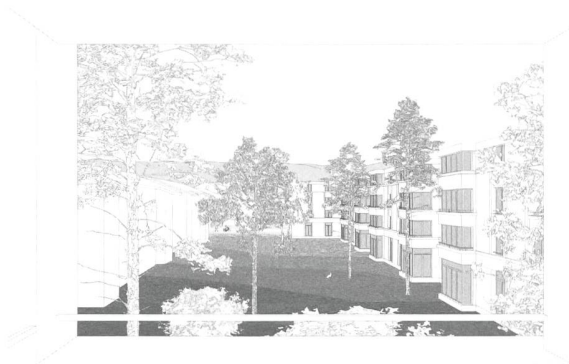
Impression des Wohngefühls in der Neubausiedlung.

Vorschlag für das Baufeld 7. Sie platziert dort zwei Punkthäuser mit 34 mehrseitig ausgerichteten Grossraumwohnungen. Die Kombination von zwei Projekten ergibt gemäss Jury mehr als die blosse Summe ihrer Wohnbauten: Einerseits bereichert sie die Vielfalt und die Identifikation im Quartier, und andererseits ergibt sie für die Baugenossenschaft Waidmatt einen Mehrwert in Form eines vielfältigen Wohnangebots.