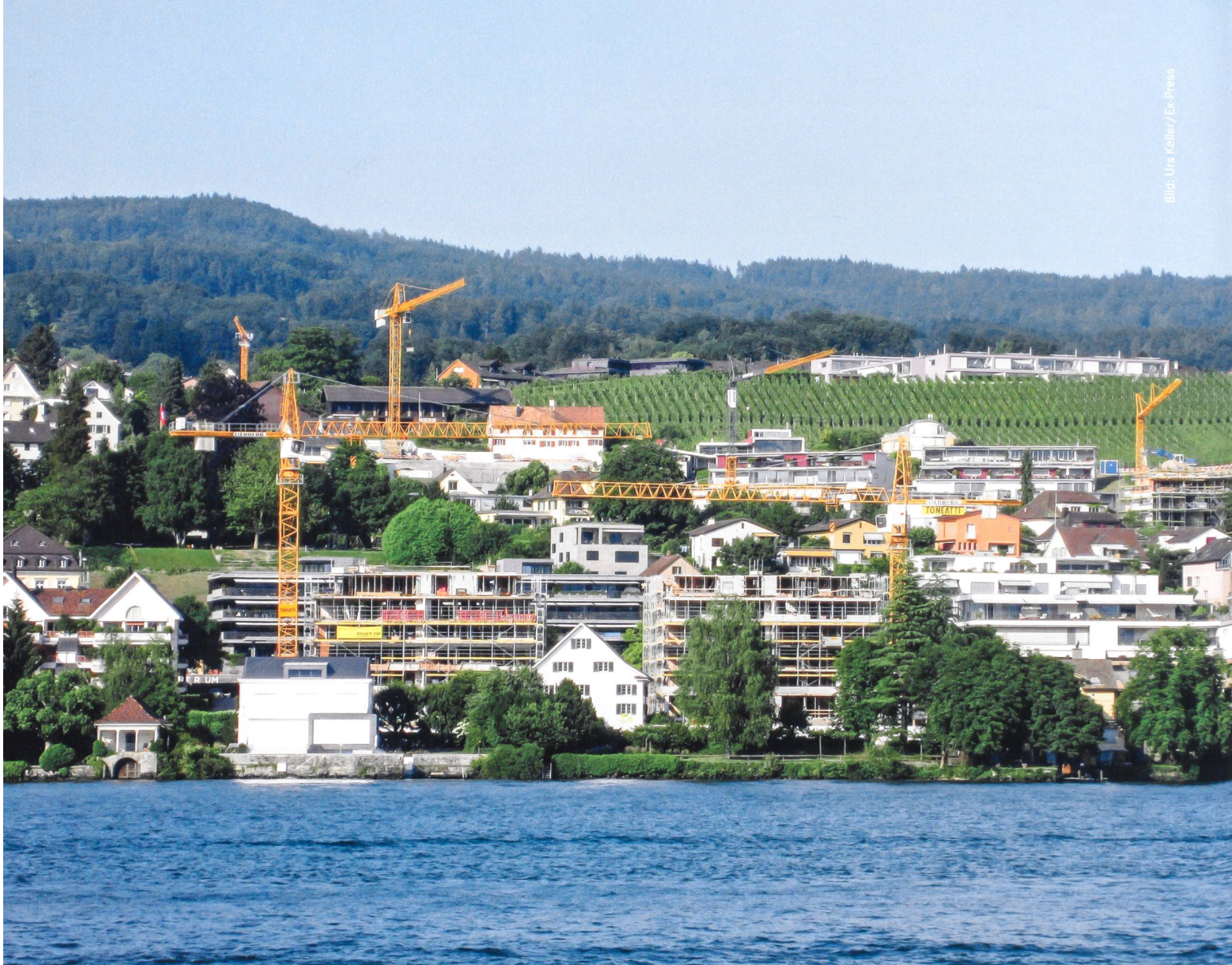
Das revidierte Raumplanungsgesetz hat zum Ziel, der weiteren Zersiedelung der Schweiz entgegenzuwirken. Bild: Stäfa am Zürichsee, wo der Rebberg immer mehr überbaut wird.

VLP-Direktor Lukas Bühlmann zur Umsetzung des revidierten Raumplanungsgesetzes