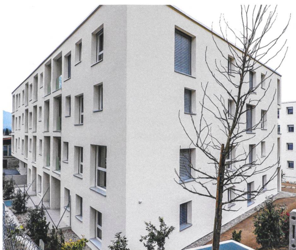
Die Alloggi Ticino bietet in der Neubausiedlung in Gordola gemeinschaftliches Wohnen für ältere Menschen an.

Der Kanton Tessin ist für den genossenschaftlichen Wohnungsbau zwar noch ein weisser Fleck, was sich mit