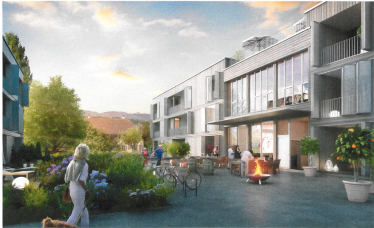
Visualisierung des Projekts Kochermatte, das viel Raum für die Gemeinschaftlichkeit bietet.

Den Grundstückseigentümern war es wichtig, den Zweck mitzubestimmen und einen nachhaltigen Mehrwert für die Gesellschaft zu generieren. Ein Baurechtsvertrag war Basis für eine gemeinsame Zusammenarbeit. Mittels eines Studienauftrags fand man mit dem Projekt des Bieler Architekturbüros :mlzd die beste konzeptionelle Lösung. Letztes Jahr er-