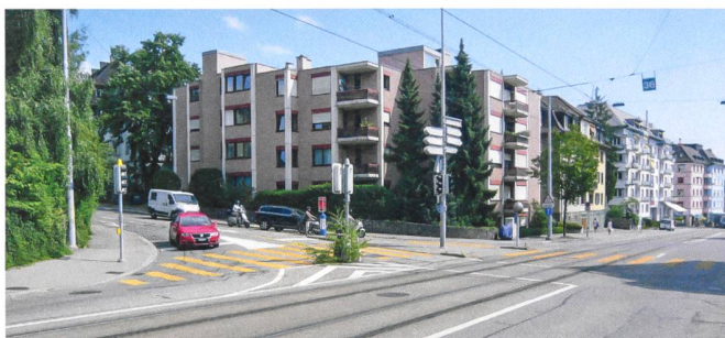
Der Gebäudekomplex an der Hofwiesenstrasse vor dem Umbau.