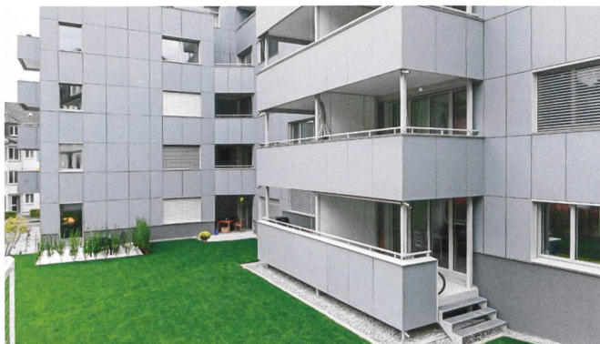
Blick von der Gartenseite: Das Gebäude wurde gänzlich neu eingekleidet.