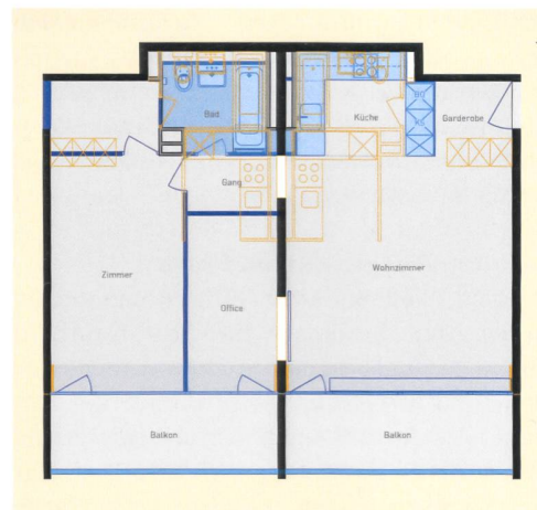
Ein Teil der Einzimmerwohnungen wurde zu attraktiven 2 1/2-Zimmer-Einheiten zusammengelegt.

2 1/2-Zimmer-Wohnung (66–72 m 2 ) alt: 950 CHF (Durchschnitt) neu: 1134–1257 CHF plus jeweils 126 CHF Nebenkosten 4 1/2-Zimmer-Wohnung (94 m 2 ) alt: 1290 CHF (Durchschnitt) neu: 1618 CHF–1736 CHF plus jeweils 156 CHF Nebenkosten