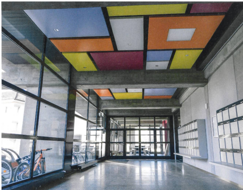
Im neu verglasten Erdgeschoss konnte ein Gemeinschaftsraum eingerichtet werden.

Einen Knackpunkt bildeten auch die Fassadenelemente, die das Erscheinungsbild wesentlich prägen. Die massiven Betonteile besaßen nur eine minimale Dämmung. Zudem war unklar, wie sie überhaupt an der Fassade befestigt waren und wie weit ihr Gewicht der Tragstruktur standhalten würde. Gemeinsam mit einem grossen Zementunternehmen entwickelten die Architekten deshalb eine gänzlich neue Lösung, nämlich dünne, leichte Elemente aus Faserzement, die sich jedoch optisch kaum von der früheren Fassade unterscheiden. Mit ihrer