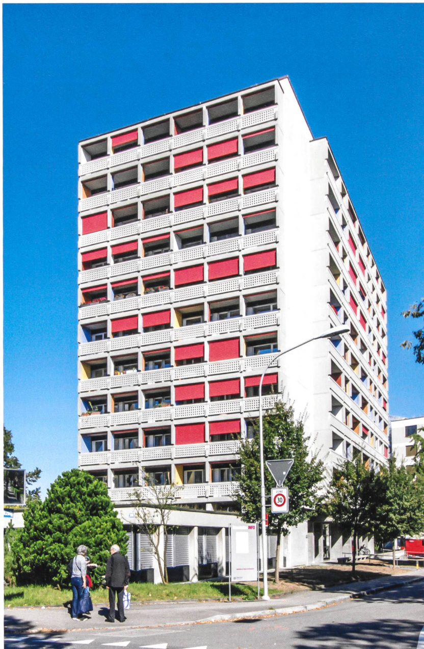
Strassenfassade mit vorgelagerter GBL-Geschäftsstelle. Die neuen Fassadenplatten aus Faserzement unterscheiden sich kaum von den früheren Betonelementen.