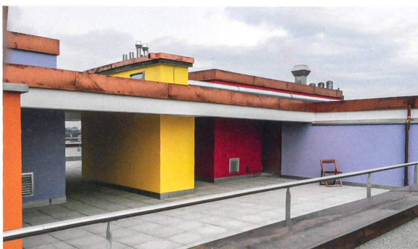
Die ebenfalls sanierte Dachterrasse steht allen Bewohnerinnen und Bewohnern zur Verfügung.

dicken Dämmschicht aus Mineralwolle bieten diese Platten allerdings einen zeitgemässen Wärmeschutz. Im Balkonbereich durften die Architekten eine weitere Massnahme realisieren, um die Betonoptik aufzufrischen. Jeweils eine Balkonseite ist nämlich in fünf verschiedenen Farbtönen gehalten, die aus der Le-Corbusier-Palette stammen. Dasselbe attraktive Farbkonzept findet sich im neugestalteten Erdgeschoss und auf der Dachterrasse.