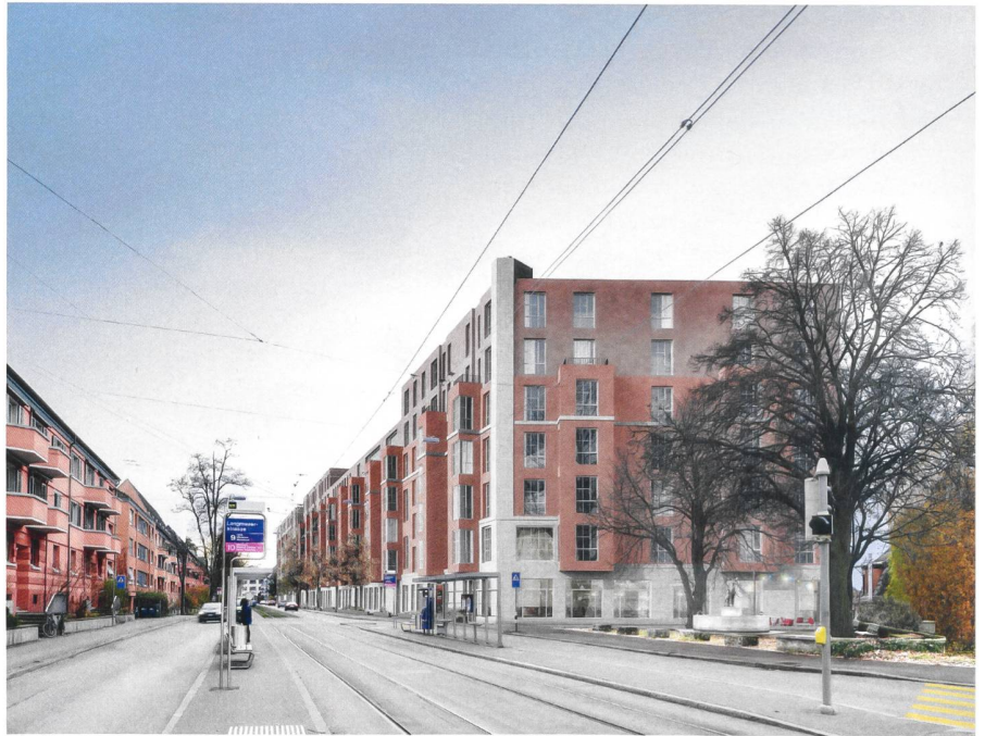
Das Atelier Abraha Achermann entschied den Architekturwettbewerb für sich. Die Jury lobte den städtischen Ausdruck der Neubauten.