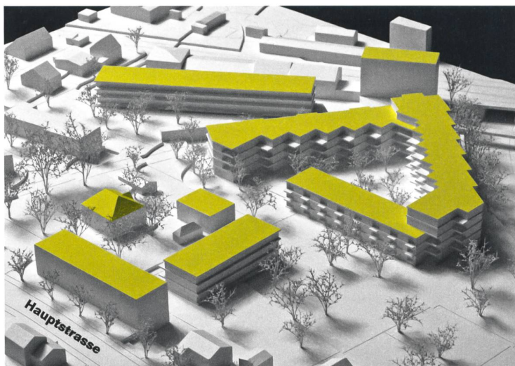
Das Neubauprojekt umfasst verschiedene Teile. Herausragend ist der dreieckige Grossbau, der ganz für die Baugenossenschaft Frohes Wohnen reserviert ist. Beim Gebäude mit dem Giebeldach handelt es sich um die bestehende Villa Strebel.

Das Preisgericht entschied sich einstimmig für den Entwurf von Oester Pfenninger Architekten AG, Zürich. Ihr Entwurf basiert auf einem Prinzip verschiedener Nachbarschaften. Er strebt keine Einheit an, sondern konzentriert sich auf eine Vielfalt an Lösungen, die auf die jeweilige Mikrolage und die Bedürfnisse der drei Bauträger eingehen. So wird die Anlage an der Nordwestseite durch einen Langbau begrenzt, eine eigentliche «Wohnmaschine», die im Erdgeschoss gewerbliche Nutzungen beherbergt. Als markantestes Element entsteht ein drei-