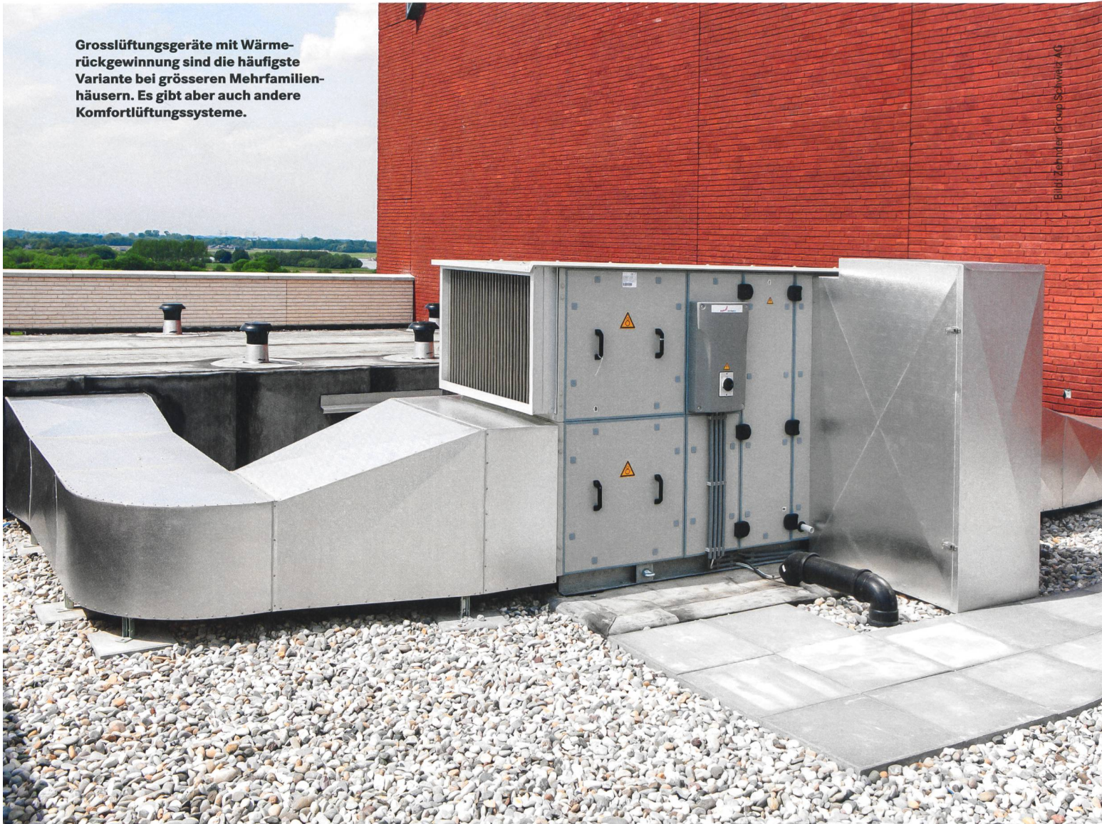
Komfortlüftungen: Stand der Technik

Grosslüftungsgeräte mit Wärmerückgewinnung sind die häufigste Variante bei grösseren Mehrfamilienhäusern. Es gibt aber auch andere Komfortlüftungssysteme.