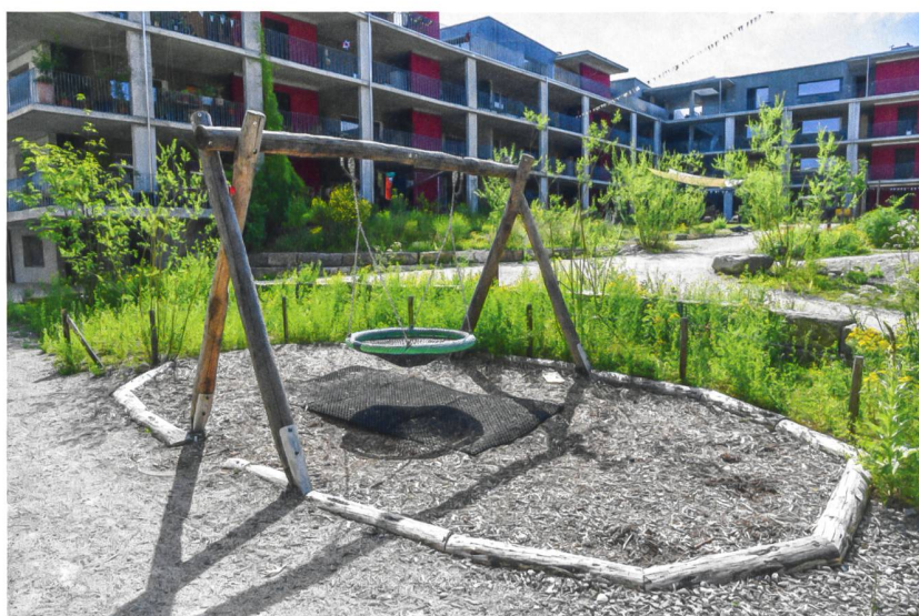
Naturnahe Gestaltung und Kinderspiel gehen Hand in Hand.

Kleine private Gärtchen gibt es im Oberfeld aber trotzdem. Die paar Quadratmeter unmittelbar vor einer Parterrewohnung dürfen nach Lust und Laune als individueller Sitzplatz oder als Rosengarten gestaltet werden, solange man