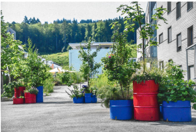
Bepflanzte Metallfässer signalisieren: Ab hier ist motorisierter Verkehr unerwünscht.

Obleich sich diese Bepflanzung momentan noch als kunterbunte Gemengelage präsentiert, werde sich im Lauf der Zeit eine Ordnung herausbilden, meint Helmut Walz: «Wir haben zusammen mit der Bewohnerschaft zahlreiche Fruchtbäume gepflanzt. Alle hiesigen Obstsorten sind mehrfach vertreten. Diese Bäume werden bis in zehn Jahren zum dominanten Element heranwachsen und zusammen mit den kleineren Gebüschchen und Stauden Gemeinschaften bilden.» Ob mit den inzwischen selten gewordenen, in der guten alten Zeit aber landschaftsprägenden Hochstämmern im Oberfeld zusätzlich zum alpinen und zum mediterranen Element eine Prise Gotthelf-Nostalgie Einzug halten wird, bleibt abzuwarten.