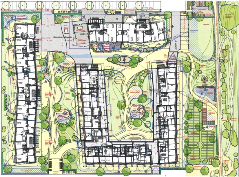
Kein Ziel fixiert: Aussenraumplanung im Oberfeld.

mengebaut sind, handelt es sich um Minergie-P-Eco-zertifizierte Gebäude, die auch die Anforderungen der 2000-Watt-Gesellschaft erfüllen. Doch wer sich angesichts dieser konsequenten Nachhaltigkeit beim Besuch im Oberfeld auf ein gallisches Dorf voller verbissener Ökofundis gefasst macht, wird angenehm enttäuscht. «Im Oberfeld soll Ökologie Spass machen. Daher gehen wir Probleme wie zum Beispiel die unerwünschte Durchfahrt von Autos konstruktiv und spielerisch an», meint der Landschaftsarchitekt Helmut Walz.