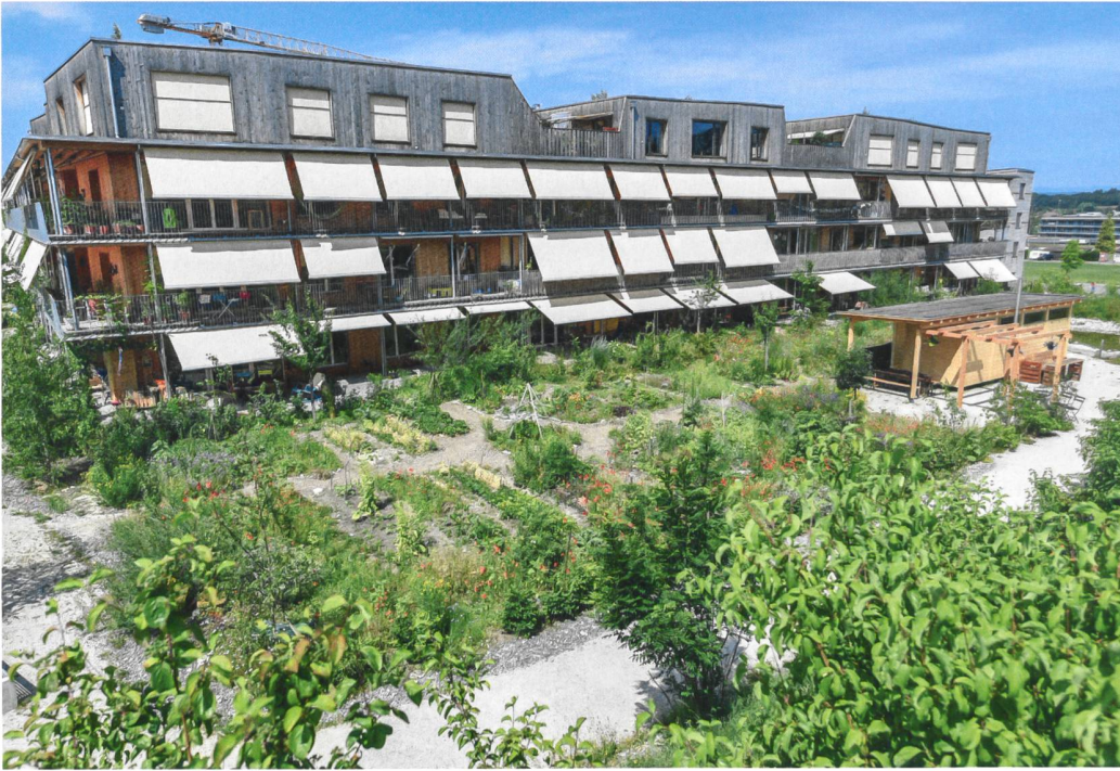
Am Ostrand der Siedlung gibt es Raum für die verschiedensten Bewohnerbedürfnisse – Grillplatz, Spielwiese, Schuppen für Sauna, Kleintierhaltung, BMX-Cross-Strecke – und ausgedehnten Gemüse- und Kräutergärten.

keine Trennwände baut und sich nicht hinter Thujahecken verbunkert. Die Bandbreite dieser privaten Nutzungen reicht vom sorgsam mit eigenem Kompost gedüngten Bio-Gemüsebeet über den funktionalen Holzrost-Sitzplatz bis hin zum Spielrasen für die Kinder. Sogar der schüchterne Versuch, ein «Mixed Border» nach englischem Vorbild zu gestalten, ist vor einer Wohnung erkennbar.