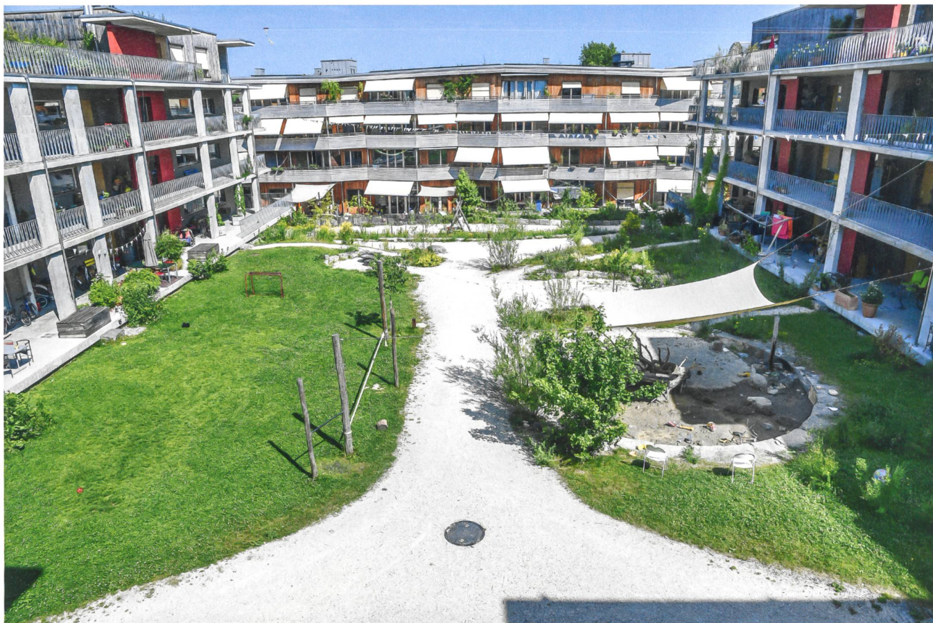
Blick in den Hof mit verschiedenen Wohnernutzungen.

Prognosen zur langfristigen Entwicklung der Siedlungslandschaft im Oberfeld sind auch deshalb schwierig, weil kein verbindlicher Endzustand vorgegeben ist. Statt ein Ziel zu definieren, wurde bloss eine grobe Ausgangslage geschaffen, die offen für vielfältige kreative Gestaltungsprozesse ist. Zur fix vorgegebenen Ausgangsstruktur gehört vor allem der Verzicht auf eine Begrädigung des Siedlungshangs. «Anfangs gab es durchaus auch die Idee, im Gelände zwei unterschiedlich hoch gelegene, waagrechte Flächen zu schaffen und den oberen und den unteren Siedlungsteil klassisch durch Treppen zu verbinden. Eine solche Terrassierung hätte dem Aussenraum allerdings einen trennenden Charakter verliehen, der das nachbarschaftliche Zusammengehörigkeitsgefühl untergraben hätte», erinnert sich Helmut Walz.