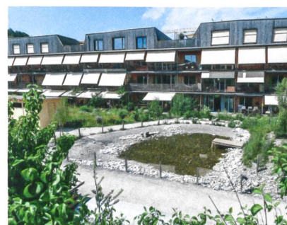
Das beliebte Biotop dient im Sommer als Planschteich für die Kinder.