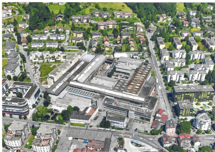
Auf dem Andritz-Areal in Kriens (LU) plant die Logis Suisse AG ein neues Quartier mit 450 Wohnungen und Gewerbenutzungen.

Die Verkäuferinnen Andritz Hydro AG und Marty Korrosionsschutz AG werden ihre industriellen Produktionen in den kommenden fünf Jahren zu neuen, nahe gelegenen Gewerbestandorten verlegen. Die technischen Büros und die Verwaltung der Andritz Hydro AG verbleiben auf dem Areal, nun als Mieterin der Logis Suisse AG. Die Logis Suisse AG wird das Areal zusammen mit der Steiner AG entwickeln. Behörden, regionale Wohnbaugenossenschaften, Kreative und Gewerblere werden zur Mitwirkung eingeladen. Um die anspruchsvollen Ziele zu erreichen, ist die Ausschreibung eines Studienauftrags geplant. Nach Abschluss des Wettbe-