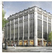
Oscar Weber Gebäude, Zürich