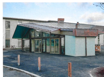
Der neue Gemeinschaftspavillon wird sich bald mit Leben füllen.