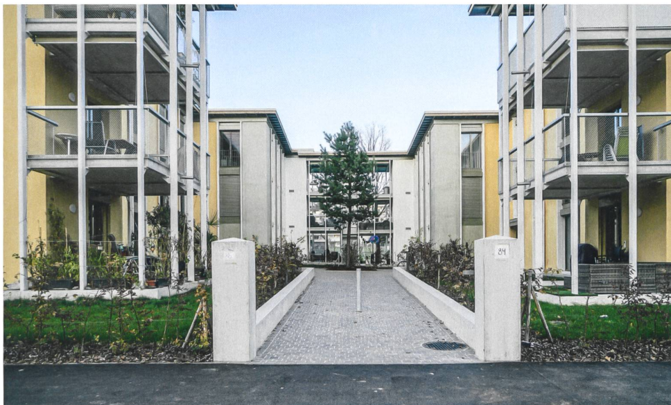
Die Türme aus gestapelten Balkonen wirken wie Tore zu den Eingangshöfen.