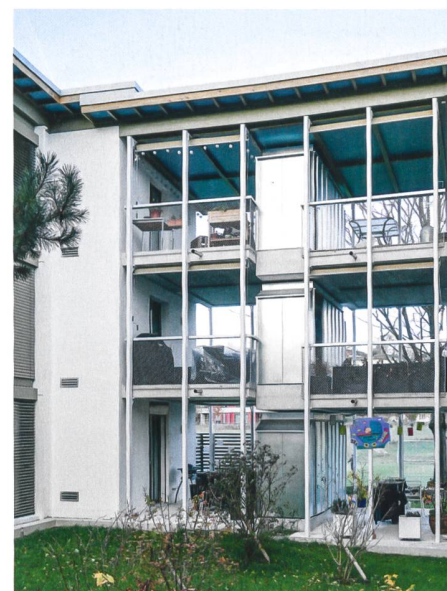
Die grossen Loggien bilden ein zusätzliches «Ausenzimmer».