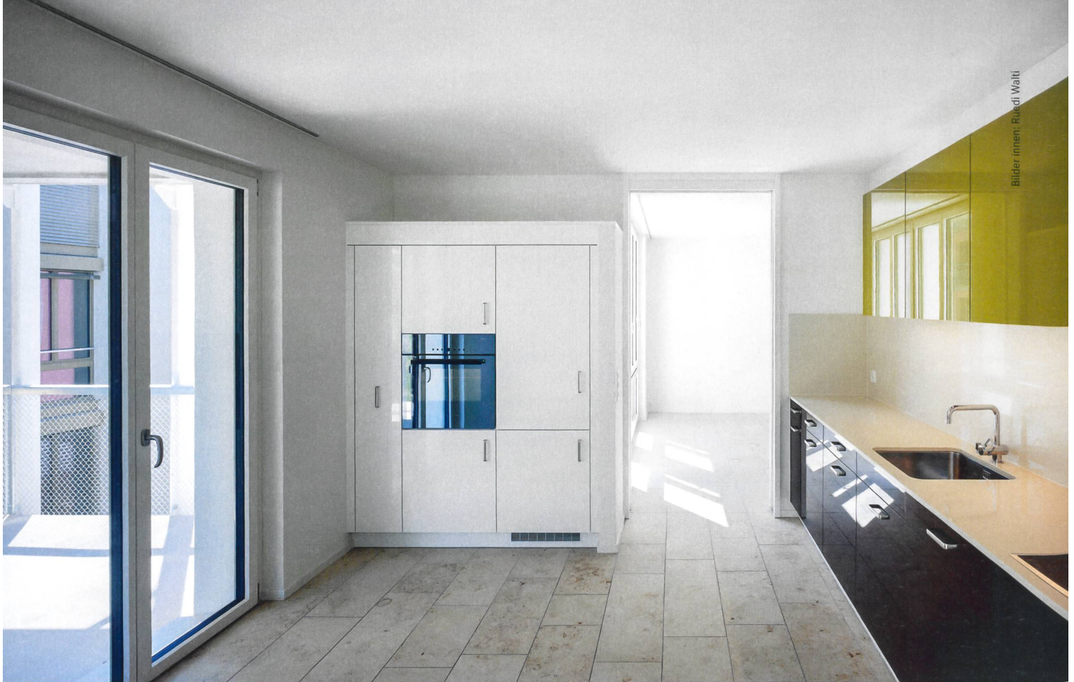
Die Natursteinböden finden sich in Wohn-Ess-Bereich, Korridor, Bad und Treppenhaus.

mit der Baugenossenschaft Linth-Escher erstellte Neubausiedlung Stähelimmatt von 2007 – liegen ganz in der Nähe. An der Generalversammlung 2010 stimmten die Mitglieder dem Kredit für einen Studienwettbewerb denn auch zu und gaben damit grünes Licht für den Aufbruch in eine neue Ära.