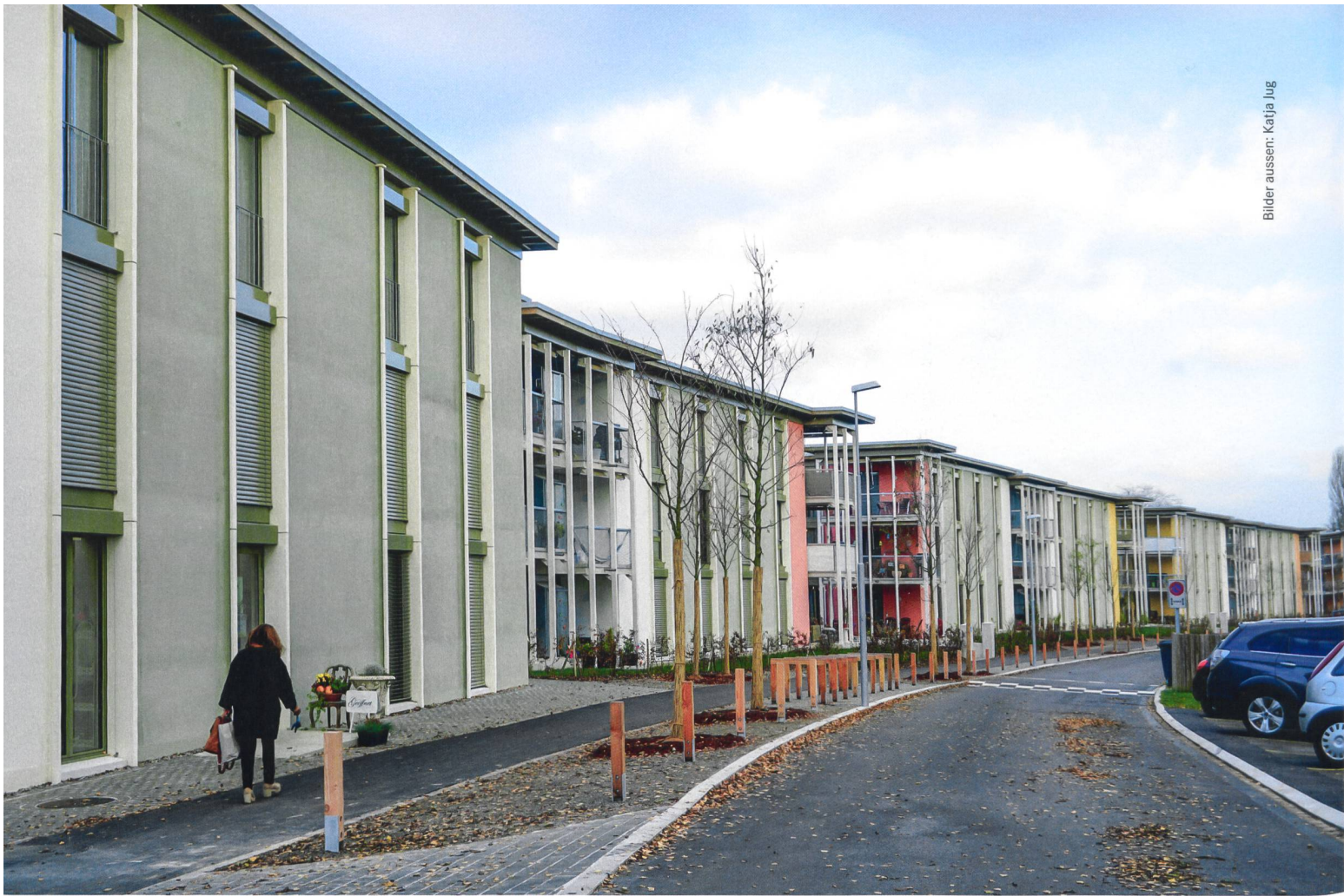
Die dreigeschossige Hauszeile bildet neu den nördlichen Abschluss der Dorfsiedlung Schönauring.

Baugenossenschaft Schönau in Zürich erneuert Nordteil ihrer Stammsiedlung