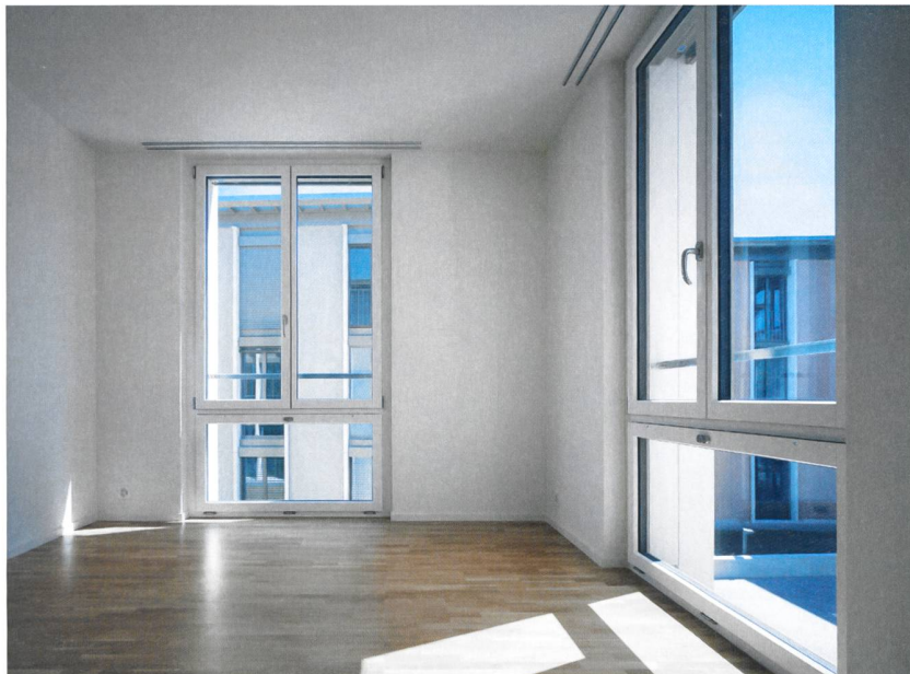
Die Wohnungen bieten dank raumhohen Fenstern viel Licht.