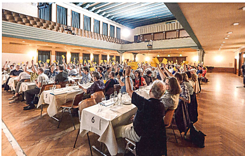
Auch wenn die Genossenschaft den Auswahlprozess steuert: Am Schluss entscheidet die Generalversammlung über den Vorstand.

Noch entscheidender wirkt sich in einer demokratisch organisierten Struktur wie einer Genossenschaft die Kommunikation aus. Die Verantwortung dafür kann der Vorstand nicht delegieren. Er steht in der Pflicht, die Wahl gut vorzubereiten. Er muss sich auch hinstellen und erklären, warum der Wahl eine Auswahl vorausgeht, warum bei Personalfragen Discretion manchmal wichtig ist, warum ein bestimmtes Auswahlverfahren gewählt wurde