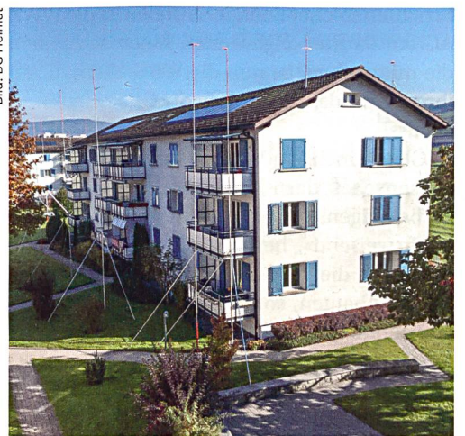
Die erste Siedlungsetappe Lauriedhofweg der WBG Heimat weicht bald dem Ersatzbau – und der neuen Energiezentrale Lüssi.