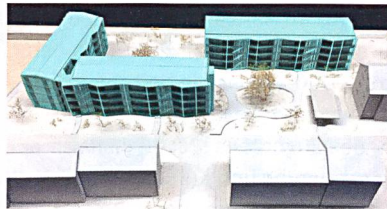
Modell der geplanten drei Gebäude.

Die drei Altbauten der ersten Baustufe Lauriedhofweg mit heute 36 kleinen Wohnungen weichen zwei Ost-West-orientierten Zeilenbauten und einer Nord-Süd-orientierten Kopfzeile mit je vier Geschossen. Beim 20,5-Millionen-Neubauprojekt entstehen 40 zeitgemässe und barrierefreie Wohnungen sowie eine Tiefgarage. Der Mix aus 8 Wohnungen mit zweieinhalb, 17 Wohnungen mit dreieinhalb und 15 Wohnungen mit viereinhalb Zimmern soll für eine gute Durchmischung der Bewohnerschaft sorgen. Zudem schaffen flexible Grundrisse und ein einfach abtrennbares Wohnzimmer vielfältige Nutzungsmöglichkeiten für verschiedene Wohn- und Lebensformen. Eine vorgelegerte, leicht geknickte Laubenschicht erschliesst die Gebäude; sie enthält auch private Aussenräume und ermöglicht Begegnungen. Auf der gegenüberliegenden Seite verfügen die Wohnungen zusätzlich über Loggien. Ähnlich wie in der bestehenden Siedlung sind grosszügige Aussen-