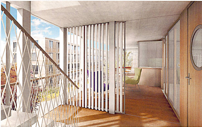
Visualisierung: Darlington Meier Architekten

Breite Laubengänge erschliessen die Gebäude.