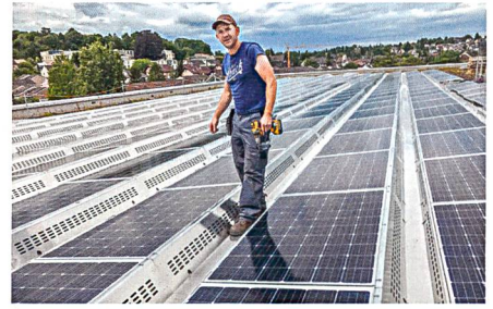
Heute ist es bereits günstiger, mit Photovoltaik Strom zu produzieren, als den Strom vom Energieversorger zu kaufen.