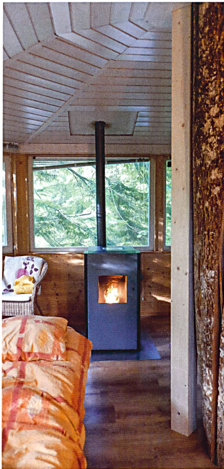
Gemütlich: Schwedenofen und viel Holz.

Der einzige Wermutstropfen unseres von Stahlseilen und Pfosten gestützten Refugiums: Die Esche, um die es gebaut wurde, schaut nicht eben gesund aus. Ihr Stamm in der Mitte des Raums weist einen grossen Spalt auf, und ein Augenschein von draussen zeigt, dass die Baumkrone fehlt. Die Gastgeberrolle scheint der Esche also nicht gut zu bekommen. Für uns Besucher hingegen ist für alles gesorgt, und es ist zugegebenermassen angenehm, trotz viel Natur rundherum auf keine Annehmlichkeiten des zivilisierten