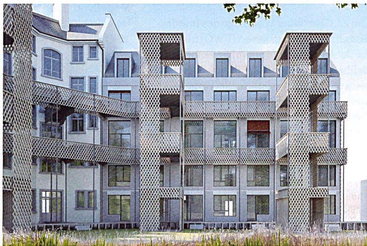
Das historische Eckhaus wird beidseitig mit Neubauten ergänzt, Laubengänge und eine Plattform schaffen Begegnungsräume.

Aus dem Wettbewerb gingen Wild Architekten aus Zürich als Sieger hervor. Sie erweitern das Haus Eber beidseitig und führen dabei die vorhandene Gebäude- und Dachvolumetrie fort. Die Wohneinheiten sind mehrheitlich als Maisonettes mit überhohen Wohn-/Essbereichen organisiert und trennen mit unterschiedlichen Ebenen geschickt die Gemeinschaftsräume von den Individualzimmern. Jedes zweite Geschoss wird über