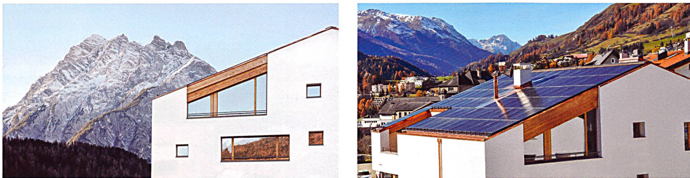
Bei der Siedlung Monolith in Scuol (GR) wird Solarwärme zur Regeneration des Erdspeichers eingesetzt. Durch verschiedene Anlagen wird getestet, welche Kombination von PV und Solarwärme die Nase vorn hat (siehe auch Beitrag Seite 18).

wärme durch die Kantone ein Problem. Und viertens leide die Technik an ihrer Komplexität: «Solarwärme ist nicht «plug and play» wie die Photovoltaik», sagt Wieland Hintz. «Die Anlagen benötigen eine genauere Überwachung, und die Überproduktion ist gerade im Sommer oft ein Problem. Zudem braucht es den hydraulischen Abgleich mit dem Heizsystem.» Deshalb beurteilt er Handling und Betrieb einer Anlage deutlich aufwendiger als bei der PV.