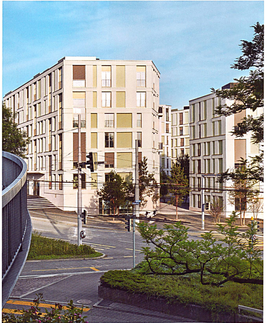
Übergrosse Fenster, Nischen und Vorsprünge prägen die Strassenfassaden, die dank der klaren Gliederung trotzdem als Gesamtsystem erscheinen.

In diesem Gesamtsystem erscheinen die Grossfenster nun wie ein Gestaltungselement unter mehreren. Da die für die Nischen verwendeten Fassadenelemente aus mineralisch verputzten Holzbauteilen bestehen, lassen sich trotz reduzierter Mauerdicke Minergie-P-taugliche Dämmwerte erzielen. Strukturiert wird das bunte Nebeneinander von Fenstern, Nischen und Vorsprüngen durch eine klare Gliederung der Fassade in Sockelgeschoss, Mittelteil und oberen Bereich. Dank den vielfältig und abwechslungsreich gestalteten Strassenfassaden wirkt die neue Siedlung auch nach aussen einladend, obwohl die Wohnungen klar zum Innenhof hin orientiert sind. Zum Eindruck einer gegen aussen offenen Siedlung tragen auch diverse gewerbliche Nutzungen in den Sockelgeschossen bei; so haben sich ein Elektrogeschäft, eine Zahnarztpraxis, eine Fahrschule und eine Reparaturwerkstätte für Alltagsgegenstände eingemietet.