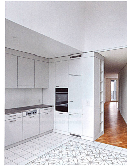
Dank der ungewöhnlichen Grundrisse verfügt jede Wohnung über Stadtblick. Der zwei Stockwerke hohe Essbereich vermittelt ein Loft-artiges Wohngefühl.

Damit sich die Baukörper trotz ihrer grossen Volumina harmonisch ins Quartier einfügen, sind die Fassaden der oberen beiden Gebäude auf halber Länge in einem deutlichen Winkel geknickt. Schliedert man strassenseitig an den Fassaden entlang, ist somit immer nur einer der beiden Gebäudeschenkel sichtbar. Dank dieser optischen Halbierung füllt die Übergrösse der neuen Bauten im Vergleich zu den um ein Vielfaches kleineren Zeilenhäusern der Nachbarschaft kaum auf. Auch hofseitig wurden die Fassaden mit mehreren, wenn auch kleineren Knicks gefaltet. «Hier ging es uns darum, die Fassadenabwicklung zu vergrössern und auf diese Weise zusätzliche Flächen für Fenster