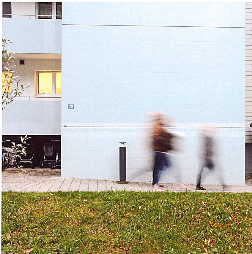
Auch ästhetisch ein Gewinn: die neuen Pollerleuchten.

der Unterhalt zu einer aufwendigen Beschäftigung entwickelt: «Vandalismus war leider ein grosses Thema. Ich musste regelmässig die Acrylgläser der Leuchten und die Halogenleuchtungen ersetzen. Viele Schrauben waren zudem dermassen ausgeleiert, dass eine Reparatur kaum noch möglich war.»