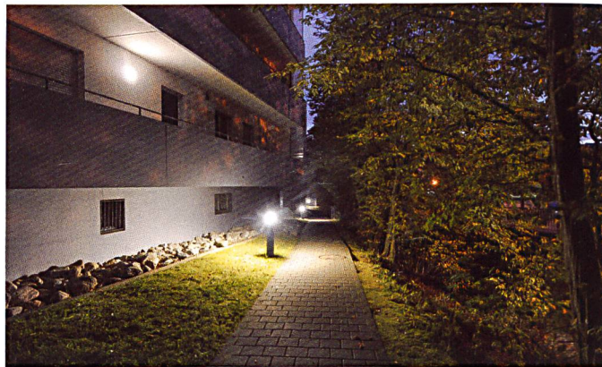
Nähern sich Menschen, erhöhen die Leuchten blitzschnell ihre Leistung.