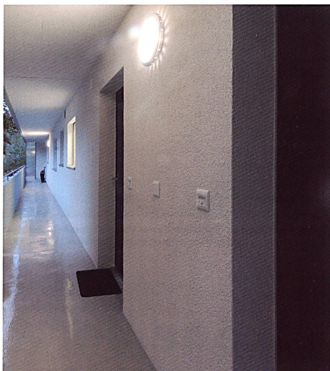
Die LED-Leuchten in den Treppenhäusern und Laubengängen passen sich dem Bedarf an – und schalten sich schliesslich ganz aus.

www.nbr.immo www.nevalux.swiss www.slg.ch