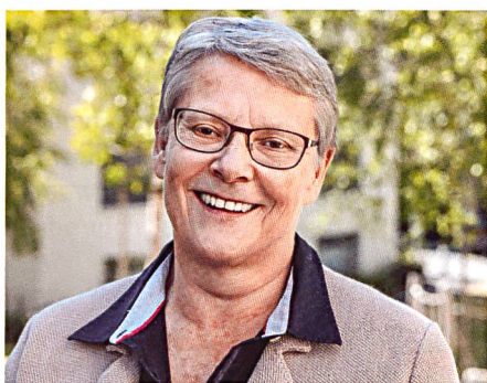
Die Waadtländer Regierungsrätin Béatrice Métraux ist froh um das neue Wohnbauförderungsgesetz.

Das Gesetz umfasst zwei unterschiedliche Teile: einerseits die Erhaltung, andererseits die Förderung des Mietwohnungsbestands. Was die Erhaltung angeht, so bedeutet es eigentlich die Fusion von zwei früheren Gesetzen, dem LDTR und dem LAAL. Einfach ausgedrückt geht es um Folgendes: Wenn eine Wohnung oder ein Gebäude renoviert, umgebaut oder gar abgebrochen und neu erstellt wird, stellt das Gesetz sicher, dass die Eigentümer nicht insofern davon profitieren, als sie die Mieten überproportional erhöhen. Es ist also ein Schutz, der garantiert, dass bezahlbare Wohnungen auf dem Markt bleiben. Weiter umfasst das L3PL Anpassungen im energetischen Bereich oder bei der Umwandlung von Büros in Wohn-