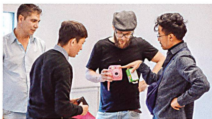
«Interact» bringt mit «Stadtstricken», Kaleidoskopbauen und Fotografieren verschiedenste Menschen zusammen.

schichten. Das ist Himmel!» Früher engagierte sie sich auch beim Präventionsprojekt Femmes-Tische, und seit vier Jahren sitzt sie im Ausländerinnen- und Ausländerbeirat der Stadt. «Die Schweiz ist ein unglaubliches Land mit klaren Regeln. Ich liebe das.» Damit die Zugewanderten aber ihre Rechte wahrnehmen könnten, bräuchten sie eine Einführung in die politische Partizipation in der Schweiz. Auch dafür will sie sich engagieren.