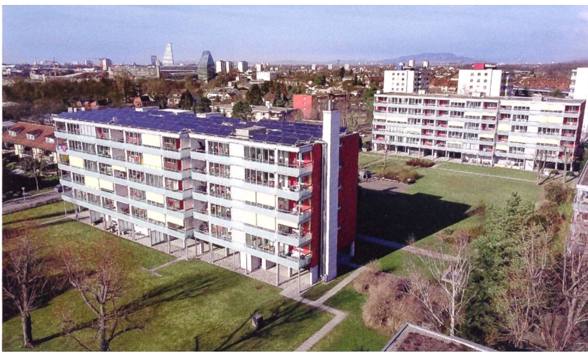
Die Siedlungen Käppeli I und Käppeli II in Muttenz (BL) bestehen aus 6 Mehrfamilienhäusern mit insgesamt 132 Wohneinheiten.