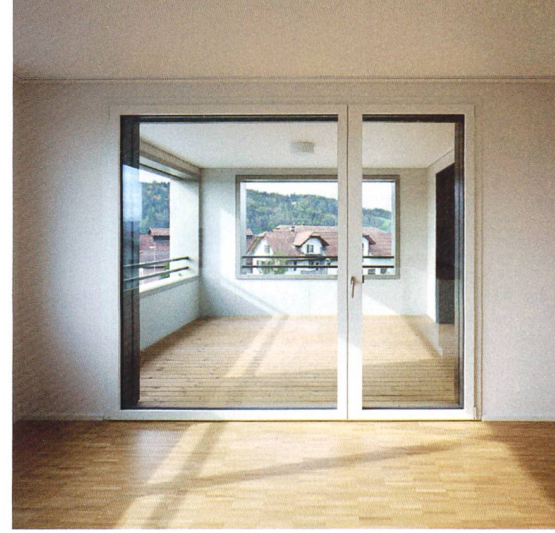
Swisswoodhouse ist ein von Bauart und Rengli AG konzipiertes Holzbausystem, das den Anforderungen an die 2000-Watt-Gesellschaft entspricht. Das erste Swisswoodhouse entstand in Nebikon (LU). Das gesamte Gebäude wurde im Werk vorgefertigt und vor Ort in nur drei Wochen montiert.

Wohnen: Sie arbeiten als Architektin beim Büro Bauart Architekten und Planer in Bern und leiten die Plattform modulart.ch , die sich dem Thema der systematischen Bauweise verschrieben hat. Wie ist diese Plattform entstanden?