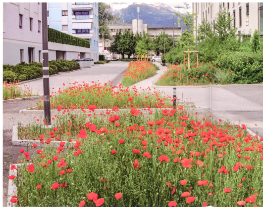
Die Gemeinde Sion führt eines der vom Bund unterstützten Pilotprojekte. Sie begegnet der Hitzebelastung mit Massnahmen wie der Aufwertung der Avenue du Bietschorn (Bild vor/nachher, oben) oder der Cour Roger Bonvin (unten links), unterstützt aber auch private Bauträger.