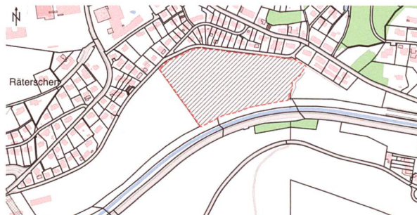
Im Gebiet Rietwisen in der Gemeinde Elsau bei Winterthur wird die Bahoge eine Siedlung mit rund 165 Wohnungen erstellen.