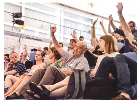
Die Delegierten bewilligten eine Vergrösserung des Vorstands.