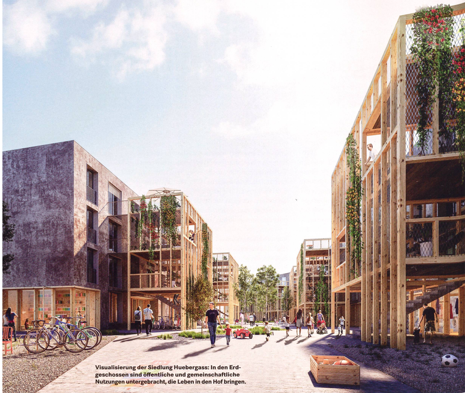
Visualisierung der Siedlung Huebergass: In den Erdgeschossen sind öffentliche und gemeinschaftliche Nutzungen untergebracht, die Leben in den Hof bringen.

Mit dem Projekt Huebergass in Bern verfolgt die Wohnbaugenossenschaft «Wir sind Stadtgarten» ehrgeizige Ziele