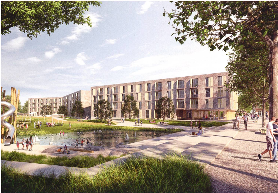
Zum Projekt gehört auch ein neuer Stadtteilpark. Damit es nicht zu Konflikten wegen Lärmimmissionen kommt, besitzt die Wohnsiedlung keine privaten Aussenräume gegen diese Seite.

nerin. Das ist in unserem Fall eben die Firma Halter, die Vorleistungen finanziert und danach als TU Qualität, Kosten und Termine gewährleistet. Ohne diese Sicherheit wären die Mietzinse heute nicht dort, wo sie sind – und genauso wenig hätten wir sie schon vor Baustart garantieren können. Dabei unterscheidet sich unser Vertrag nicht von anderen Halter-Kunden. Das Darlehen für die Vorleistungen haben wir denn auch bis auf den letzten Rappen zurückgezahlt.