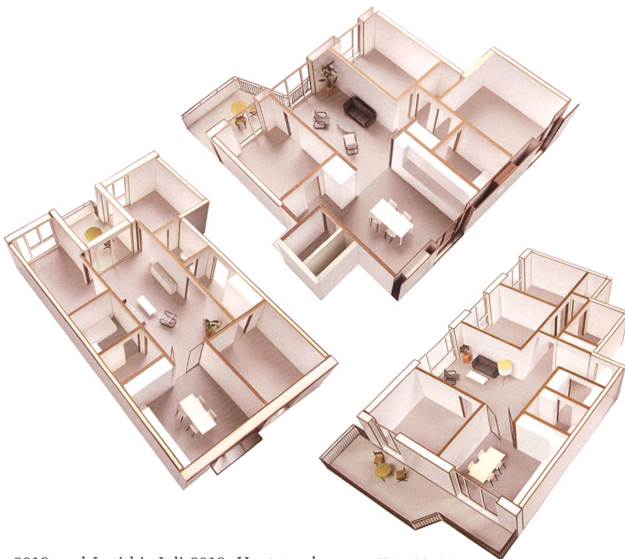
Verschiedene Grundrisstypen der 4 1/2-Zimmer-Wohnung.

Mit Leben füllte sich die Siedlung Glattpark schliesslich durch die beiden Bezugsetappen zwischen Oktober und Dezember