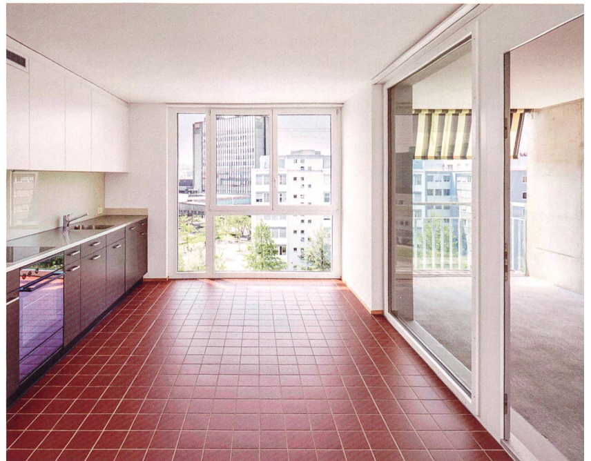
Einblick in verschiedene Wohnungstypen und Treppenhaus.