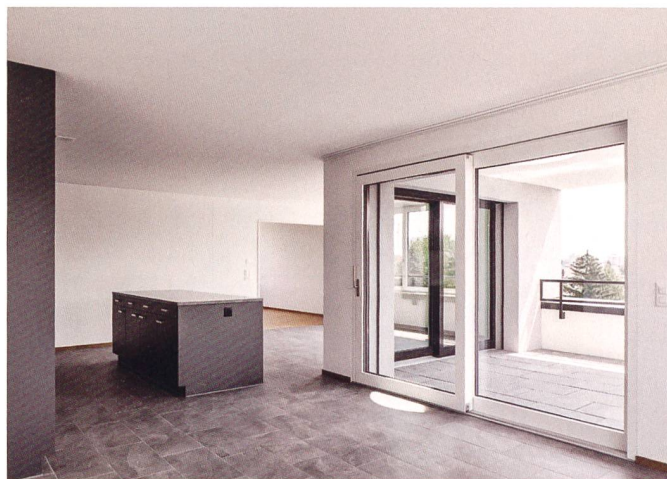
Einblicke in Wohnungen der Siedlungsteile Süd und Nord.

sondern bei der grösseren zeitlichen Kapazität der Genossenschaftsverantwortlichen, die im zweiten Siedlungsteil selbst für die Auftragsvergabe verantwortlich zeichneten. Dabei konnte man auf die Erfahrungen aus der ersten Etappe abstellen. So entschied man sich bewusst für eine höhere Bauqualität. Die erste Etappe weist beispielsweise eine Kompaktfassade auf, während die zweite in Zweischalenmauerwerk ausgeführt ist. Auch bei der Auswahl der Handwerker wie etwa des Küchenbauers setzte man nicht auf das günstigste, sondern auf das vertrauenswürdigste und nachhaltigste Angebot. Ein wichtiges Kriterium bildeten dabei die langfristigen Unterhalts- und Ersatzkosten.