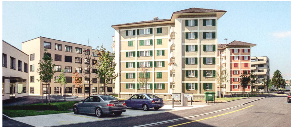
Drei Wohntürme aus den 1950er-Jahren blieben erhalten. Links: Neubauten der Etappe Süd.