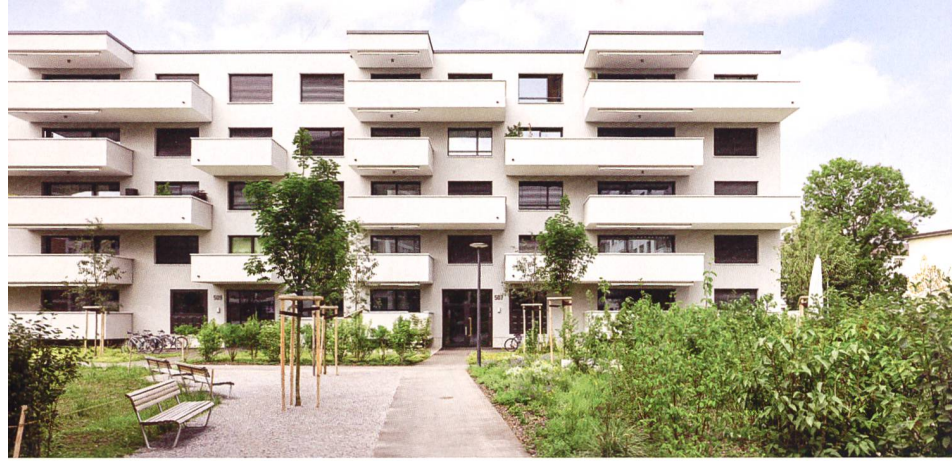
Die parkartigen Grünräume bieten ein Netz aus Wegen und Treffpunkten (Etappe Nord).