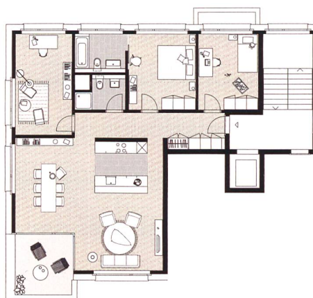
Grundrisse zweier Wohnungstypen mit viereinhalb Zimmern in der Etappe Süd (links, 113,9m 2 ) und Nord (rechts, 116,9m 2 ).

Mit dem Bezug der zweiten Etappe vom vergangenen Jahr ist der Bestand der Genossenschaft auf 601 Wohnungen gestiegen. Die Vitasana, die dieses Jahr ihr 75-Jahr-Jubiläum feiern kann, würde gerne weiterwachsen, möglichst in ihrem Stammquartier Schwamendingen. Die stark angestiegenen Landpreise haben ihr bisher allerdings einen Strich durch die Rechnung gemacht. Man ist aber intensiv auf der Suche – und für Angebote offen. ■