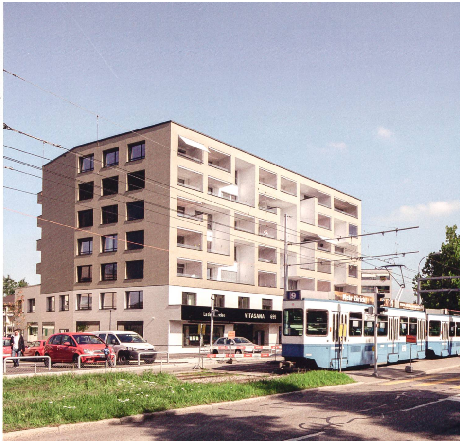
Der Kopfbau an der Luegislandstrasse bildet das markante Gesicht des erneuerten Ensembles. In den zwei Sockelgeschossen sind Gewerbenutzungen und Büros untergebracht.

ge Bauten aus den frühen 1950er-Jahren, deren Form mit den drei Flügeln an ein T-Shirt gemahnt. Sie galt es zu erhalten und instand zu setzen. Die sechs neuen Häuser besetzen die Ränder des Viertels und bilden sozusagen einen Rahmen für die markanten Altbauten, die darin geometrisch verdreht wie Fliegerstaffeln stehen. «Wir wollten keine geschlossene Figur bauen», erklärt Architekt Andreas Galli. Vielmehr sei es darum gegangen, mit einer durchlässigen Bebauung die Tradition der Garten-