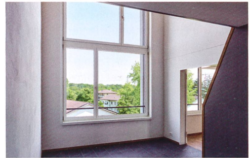
Die Vielfalt der Wohnungen umfasst auch überhohe Räume mit Galerien, die über eine Sambatreppe erreichbar sind.

stadt zu bewahren und die Siedlung mit der heterogenen Umgebung zu verknüpfen.