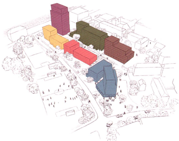
Situationsplan der Siedlung Holliger mit den verschiedenen Baufeldern und Trägern.

Das Preisgericht entschied sich für das Projekt der Arge Beam (FritschiBeis AG, Bern, und Space Encounters, Amsterdam). Sie entwarfen zwei ineinandergeschobene Volumen: Turm und Riegel. Das Dach des Riegels ist begrünt und als Treffpunkt der Bewohner gedacht, ausgerüstet mit Wäscheleine und angrenzender Waschküche. Das Erscheinungsbild mit der einfachen und robusten äusseren Struktur und den Fassaden aus