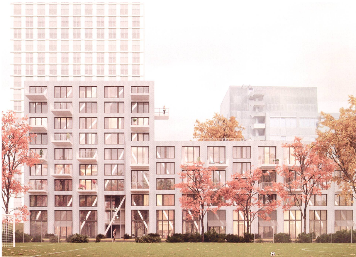
Projekt der Arge Beam für das Baufeld U1 (Baugenossenschaft Aare).

Sechs gemeinnützige Bauträger sind an der Siedlung Holliger beteiligt, die auf der Brache der ehemaligen Kehrichtverbrennungsanlage Warmbächli in Bern entsteht. Gemäss dem städtebaulichen Konzept von BHSF Architekten und Christian Salewski sind rund 300 Wohnungen, ein einladender Quartierplatz mit Begegnungszone, ein Quartierladen mit Bistro, Gewerbeflächen, ein Kindergarten, eine Kita und grosszügige Gemeinschaftsräume vorgesehen. In der Mai-Ausgabe konnten wir die Siegerprojekte für die Baufelder U3 (BG Brünnen-Eichholz) und O3 (Fam-