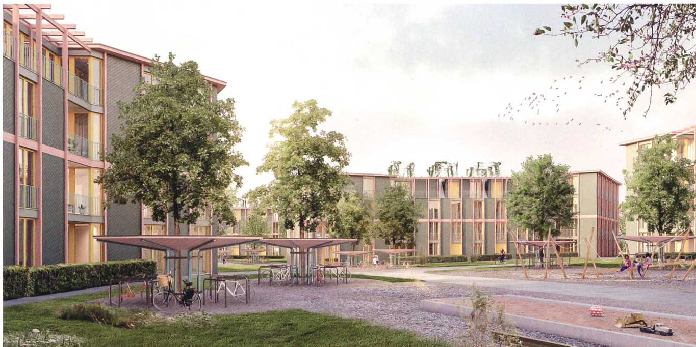
Entwurf von BS + EMI für das Projekt Buchwiesen in Zürich Seebach.

Die Baugenossenschaft Glattal Zürich (BGZ) besitzt im Quartier Seebach ganz am nördlichen Stadtrand die Siedlung Buchwiesen mit 110 Reihenhäusern. Die BGZ möchte die Hauszeilen mit Baujahr 1946/1947 wegen der alten Bausubstanz und der veralteten Grundrisse durch Neubauten ersetzen. Sie hat dafür einen Projektwettbewerb im selektiven Verfahren nach SIA durchgeführt. Der Planungsperimeter umfasst rund 28 000 Quadratmeter. Gefragt war eine Arealüberbauung mit städtebaulich besonders guter Einbindung in den heutigen und den zukünftigen Kontext, die wiederum Reiheneinfamilienhäuser umfasst. Neben Einfamilienhaustypen sollten kleine und grosse Etagenwohnungen geplant werden, die von allen Generationen genutzt werden können. Niedrige Erstellungskosten sowie die Kennwerte des Minergie-P-Eco-Standards waren weitere Anforderungen.