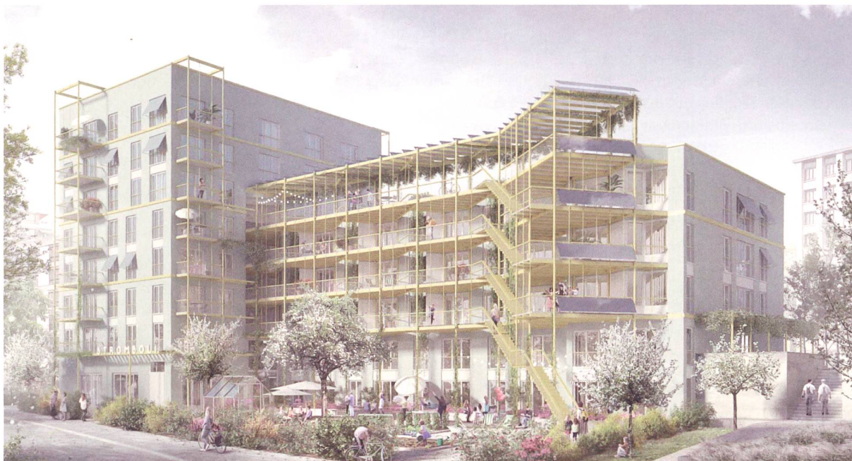
Projekt von pan m/gud Architekten für das Baufeld U2, npg AG.

Keramikplatten mutet industriell an. Es verbindet gemäss Jury die Offenheit und Grosszügigkeit industrieller Architektur mit der notwendigen Geborgenheit und Komplexität für Familienwohnungen.