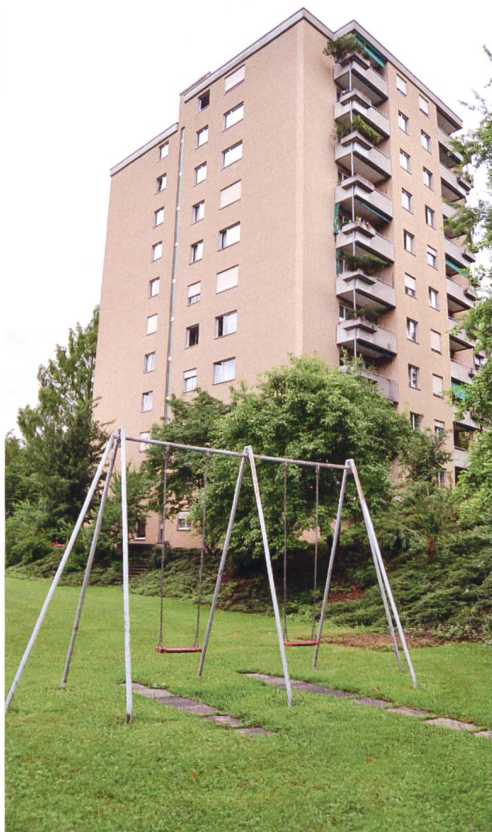
Die GBL wählte gelbe Welleternelemente für die Erneuerung ihres Hochhauses Kleinzelligli in Schlieren (ZH). Links: früherer Zustand mit Gebäudehülle aus Modulbacksteinen.