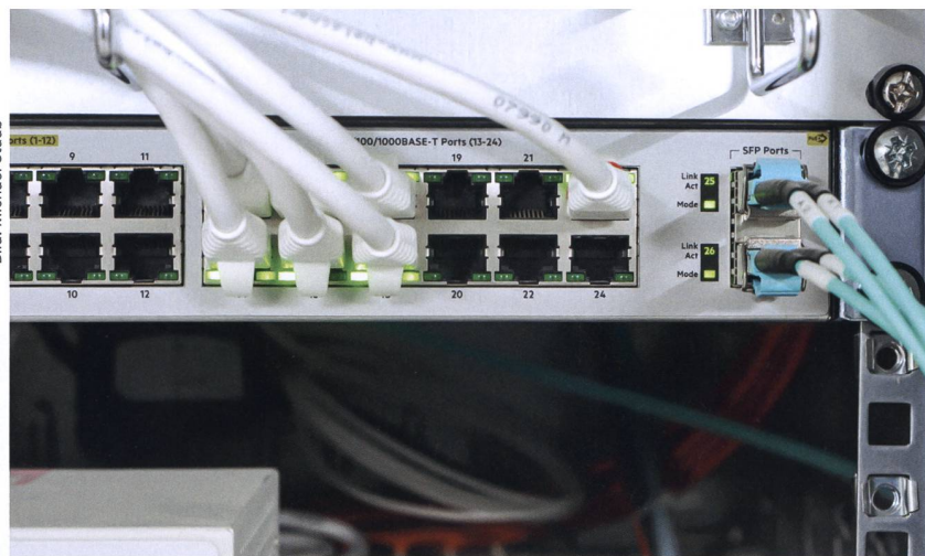
Private Netzwerke können vom Arbeitgeber nicht überwacht werden.