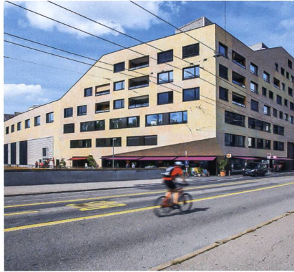
Auch das Leuchtturmprojekt «Kalkbreite» in Zürich ist zu rund einem Drittel mit EGW-Hypotheken finanziert.