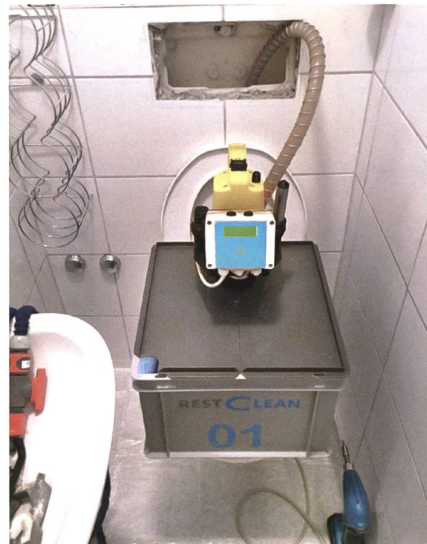
Abb.) RESTCLEAN Reinigungsgerät auf WC während Prozess

Für den Entkalkungsservice muss das WC nicht demontiert werden. In die gestauten 10 Liter lauwarmes Wasser wird ein mildes Entkalkungspulver und 125 Gramm Baumnussschalengranulat beigemischt. Das Pulver löst sich im Wasser auf und die Entkalkungslösung kann nun im ganzen System umgewälzt werden. Die chemisch-mechanische Reinigungslösung wird durch sämtliche Spül- und Wasserlaufkanäle des Spülkastens und der WC-Schüssel gespült. Der Kalk löst sich schnell und materialschonend.