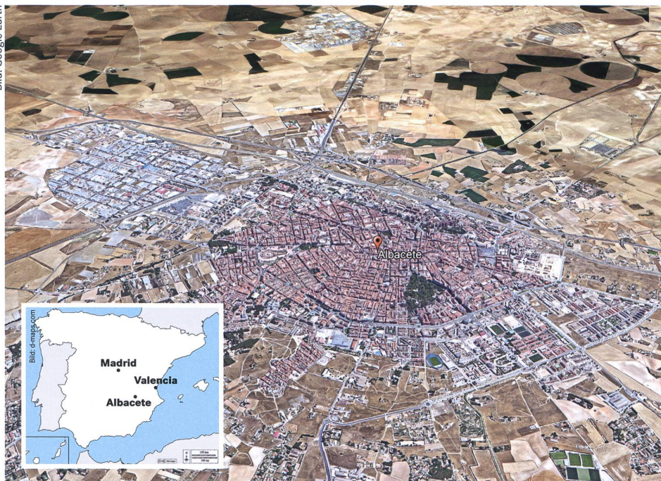
Albacete liegt in der grossen Ebene La Mancha und wirkt ein wenig wie vom Himmel gefallen.