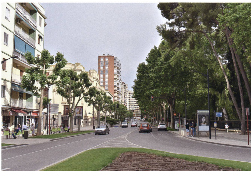
Bei sommerlichen Temperaturen von mehr als 40 Grad besonders wichtig: der Stadtpark, der sogar aus der Vogelschau ersichtlich ist (Seite 35).

Die neuen privaten Mehrfamilienhäuser am Stadtrand gleichen sich und sind wenig spektakulär. Deine Bauten – ein Beispiel ist hier abgebildet – stechen hervor, etwa durch die Fassadengestaltungen.