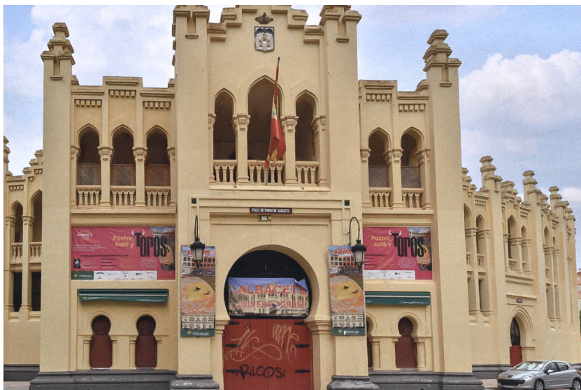
Die Stierkampfarena von 1917 lehnt sich stilistisch an die Architektur der maurischen Herrschaftszeit an. Sie verfügt über eine beeindruckende Kapazität von 12 000 Plätzen – bei damals gerade mal 32 000 Einwohnerinnen und Einwohnern.

Viele Architekten können nur kleinere Baulücken im bestehenden Gefüge schliessen. Ich hatte das Glück, dass ich grosse Parzellen oder ganze Strassenzüge planen durfte und damit viel mehr Freiheiten bei der Gestaltung hatte.