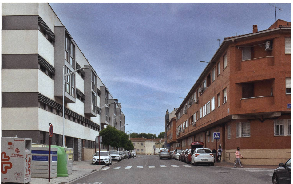
Ausserhalb des Zentrums finden sich viele niedrige Backsteinbauten, die an die traditionelle Bauweise in den Dörfern erinnern (rechts). Links eine moderne Fortführung.