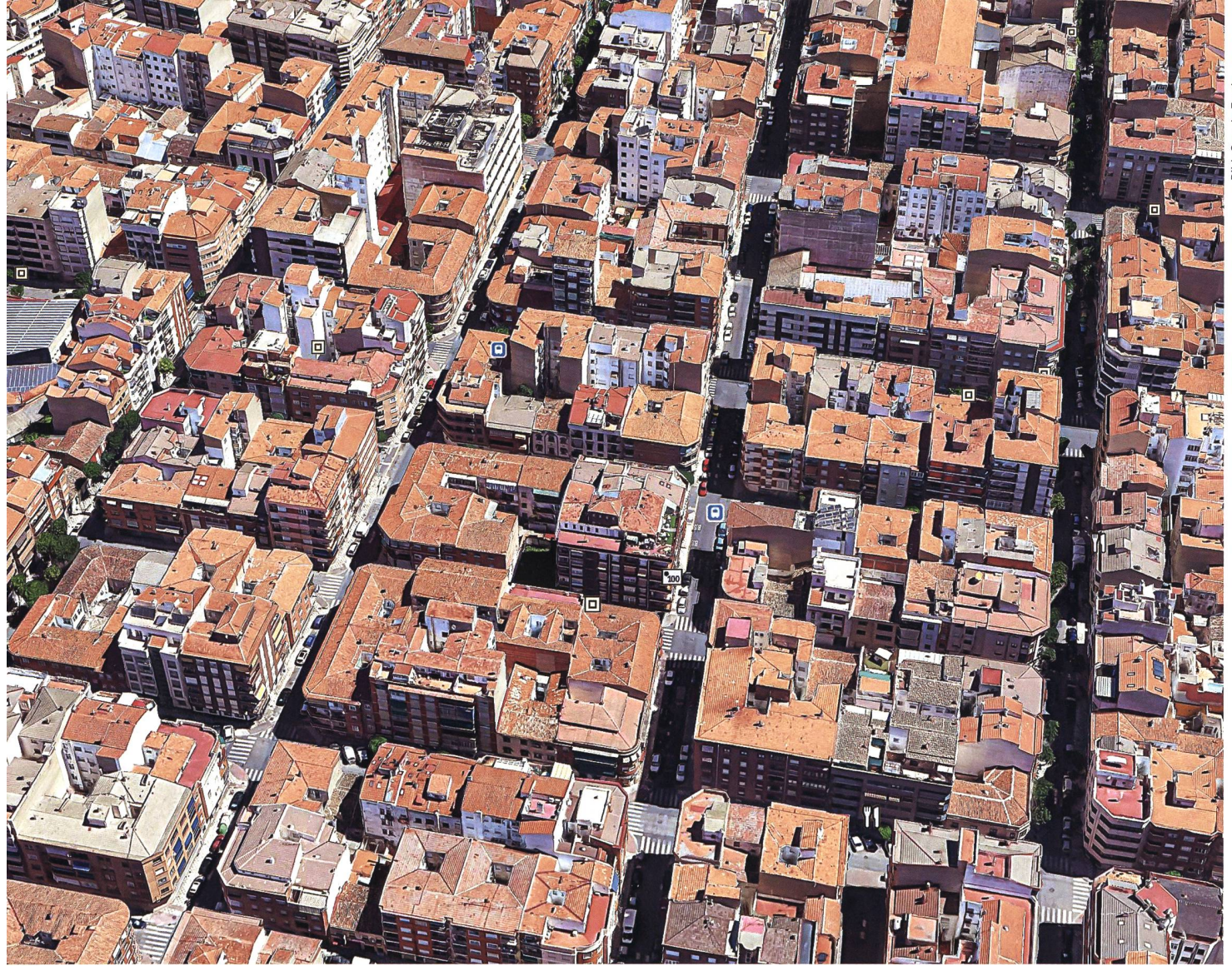
Aus der Vogelschau zeigt sich die grosse Dichte in der Innenstadt.

und der Handel mit den regionalen Produkten. Der schafft viele Arbeitsplätze. Auch besitzt die Stadt inzwischen, etwas versteckt am Rand, eine Industriezone. Keine Grossbetriebe, sondern viele Dienstleistungen, etwa Transporte von Lebensmitteln. Und nicht zu vergessen die Universität, die dafür gesorgt hat, dass auch viele junge Leute zugezogen sind.