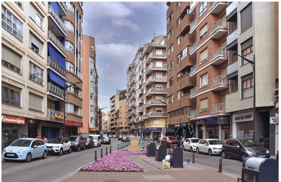
Auch im Stadtzentrum ist der Wohnanteil sehr hoch.