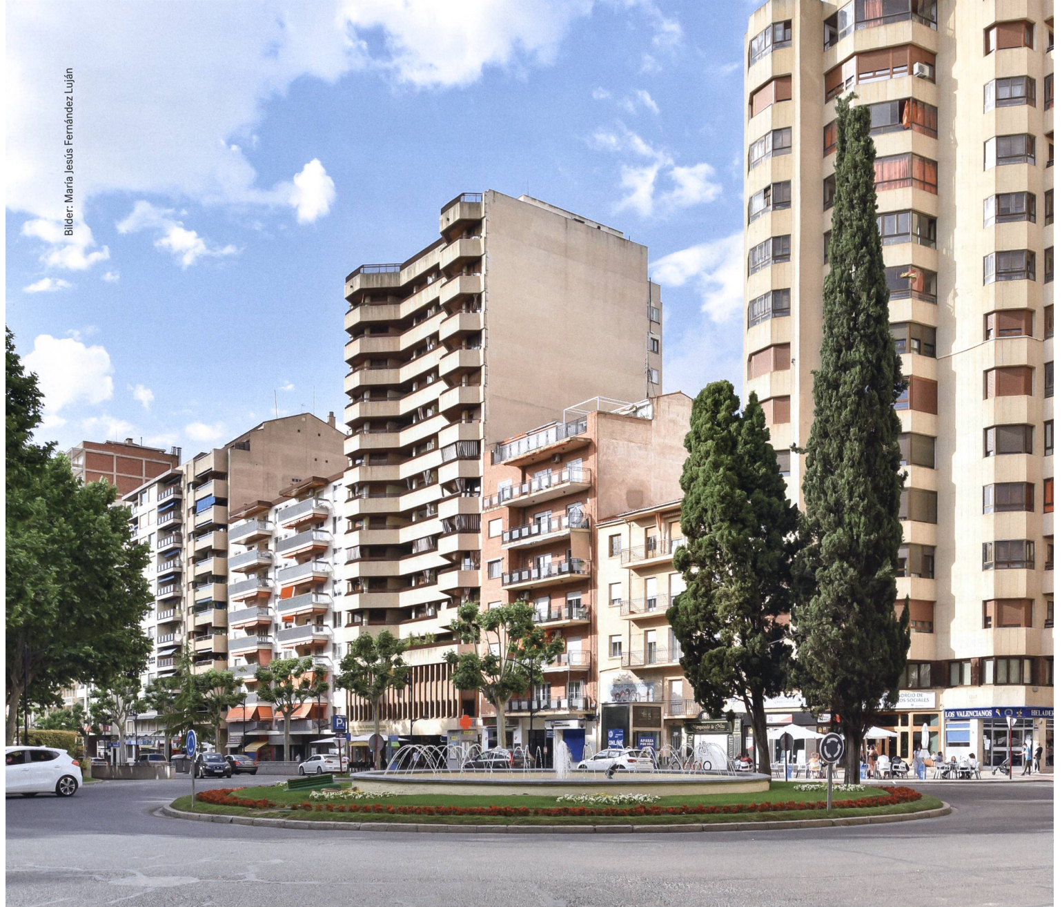
Typisch für Albacete ist das Nebeneinander unterschiedlich hoher Häuser.