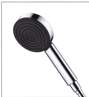
Pulsify 105 1jet Green, Hansgrohe