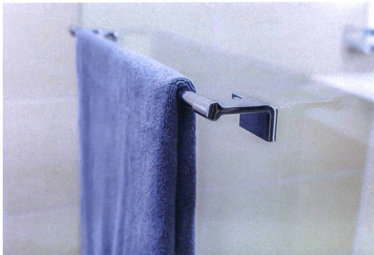
Klebelösung Adesio, Bodenschatz