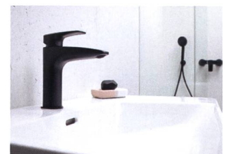
SK Laurin, Similor Kugler