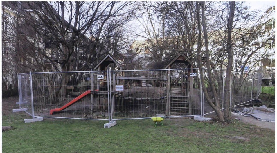
Im Frühling wurde die ganze Anlage zum Leidwesen der Kinder vorübergehend abgesperrt, wobei auch der nicht beanstandete Teil mit Türmen und Kletternetzen betroffen war.

Im Spannungsfeld zwischen attraktiven Spielplätzen und Sicherheitsdenken ist es nicht immer einfach, den richtigen Weg zu finden. «Das Sicherheitsbewusstsein hat sich stark verändert», sagt Hochstrasser. Er war über Jahre bei