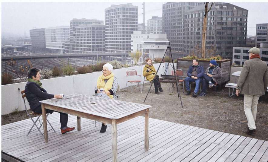
Auf dem Dach haben die Bewohnerinnen und Bewohner des Zollhauses in Zürich, das zwischen Gleisfeld, Zoll- und Langstrasse eingepfercht ist, einen grünen Freiraum erhalten. Die Maulbeerbäume sind von weitherum zu sehen, genauso wie der Spielplatz.

dass sich die Bewohnerinnen und Bewohner hier bedienen», sagt Billeter.