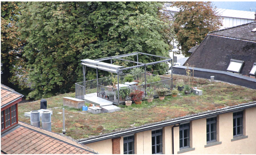
Auch auf älteren Gebäuden lassen sich Dächer als luftige Oasen nutzen – hier ein Beispiel aus dem Berner Marziliquartier. Wenn die Dächer bepflanzt werden, heizen sie sich im Sommer nicht so stark auf.

Gebäude gezogen ist, und ist von einem hohen Zaun umgeben. In Zukunft soll er ausserhalb der Betriebszeiten des Kindergartens auch von den übrigen Zollhaus-Kindern benutzt werden können. Auf den anderen beiden Dächern sind Kinder ebenfalls gern gesehene Gäste. Allerdings können sie dort nicht unbeaufsichtigt spielen. «Die Brüstungen sind sehr niedrig. Viele Eltern erschrecken, als sie zum ersten Mal mit den Kindern auf dem Dach waren», sagt Lilian Kögler. Gemäss ihr werden die Bewohnerinnen und Bewohner das Thema möglicherweise diskutieren und gemeinsam angehen – so, wie sie es auch mit anderen Angelegenheiten machen. Trotzdem kommen die Kinder auf dem Dach auf ihre Rechnung. In den Boxen auf dem mittleren Gebäude haben die Bewohnerinnen keine Turnhalle wie bei Le Corbusier, dafür einen kleinen Sportraum mit Turnmatten, ein Malatelier und einen Werkstattraum für alle eingerichtet. «Es ist