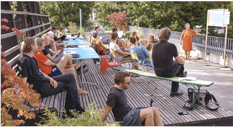
In der Siedlung Fabrikgässli 1 in Biel haben die Bewohnerinnen und Bewohner an gemeinsamen Arbeitstagen eine Pergola auf die Terrasse gebaut. Sie wird zum Sonnentanken, Grillieren, für Genossenschaftsanlässe, Konzerte und Lesungen genutzt.