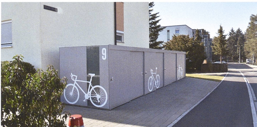
Velogarage Wohnbaugenossenschaft Kohlplatz, Rheinfelden

Zahlreiche Innovationen von Velopa unterstützen smarte Umgebungen in Wohnarealen und vereinen Konnektivität, Digitalisierung sowie Nachhaltigkeit. So laden moderne Sitzbänke auf Wunsch über ihre Solarpanels Smartphones auf und versorgen die eingebauten WLAN-Zugangspunkte mit Strom. Grössere Veloparkieranlagen lassen sich bei Bedarf mit einem Reservations- und Navigationssystem zu den einzelnen Abstellplätzen ausstatten oder mit Ladestationen für E-Bikes ergänzen.