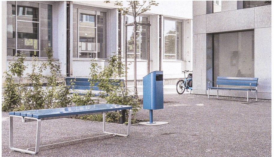
Sitzbank Toya und Abfallbehälter Kondo, Genossenschaft Hammer, Zürich

Über Jahrzehnte hat sich Velopa mit Infrastrukturlösungen für die ressourcenschonende Mobilität einen Namen gemacht. Dazu gehört heute ein vielfältiges Sortiment an digitalen und mechanischen Veloparkiersystemen, stilvolle Anlehnbügel, platzsparende Karussell- und Doppelstockparker mit hoher Flächeneffizienz bis hin zu modularen Velounterständen und Absperrlösungen. Mit Mobilitätsökosystemen für den emissionsarmen Verkehr unterstützt Velopa zudem die Mikromobilität in der unmittelbaren Umgebung des Wohnareals sowie bis zum nächsten Mobilitäts-Hub mit Anschluss zum öffentlichen Verkehr. Für den weitergehenden Mobilitätsbedarf der Wohnungsmieterinnen und -mieter stellt das Unternehmen komplette Sharing-Plattformen mit E-Fahrzeugflotten bereit.