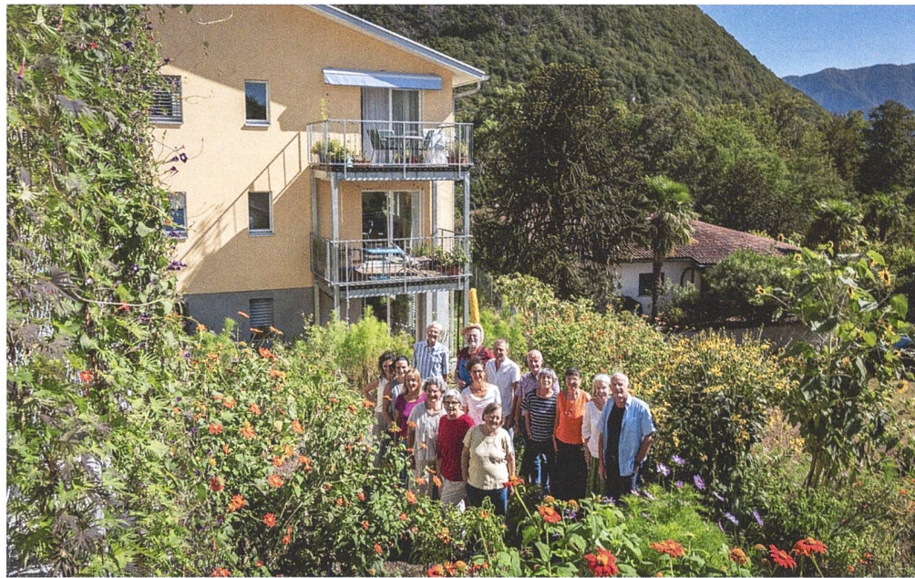
Etwa 25 Erwachsene und zehn Kinder leben aktuell in den drei Gebäuden von Viv Insema. Am Gemüsegarten können sich alle beteiligen, die ein Stück Garten bewirtschaften möchten.

Hippiekommune? Ein Besuch der Genossenschaft in Tegna führt zu drei Wohnhäusern mit insgesamt 17 Wohnungen; die kleinsten haben zweieinhalb, die grössten fünfzehn Zimmer. Bezogen wurden sie im Frühling 2022. Die Gebäude stehen am oberen Dorfrand auf einem schmalen Landstreifen versetzt im steilen Hang und fügen sich mit ihren gelben Fassaden unauffällig in die ortsty-