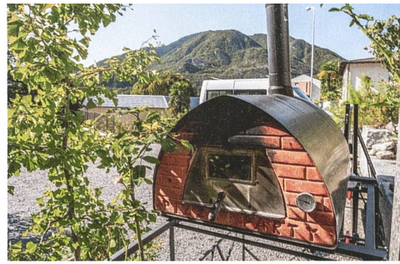
Gemeinschaftsraum und Werkstatt waren von Anfang an vorgesehen; auf Initiative von Bewohnenden ergänzen unter anderem eine Outdoor-Metallwerkstatt und ein Pizzaofen die Ausstattung.