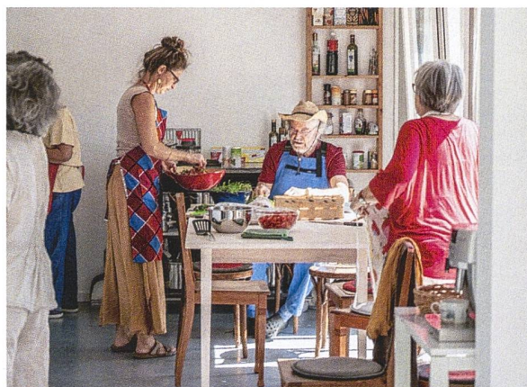
In der grossen Küche des Gemeinschaftsraums wird ein Essen zubereitet.

tagen greift zu Hacke, Giesskanne und Komposteimer, wer gerade da ist. Die Selbstorganisation, so Schmidli, funktioniert sehr gut: «Das läuft bis jetzt alles bestens auf freiwilliger Basis.» Der Gartentag sei attraktiv, die Leute machten gerne mit. Ein schönes Erlebnis sei das. «Ein Team kocht jeweils ein Essen, danach sitzen wir meist noch zusammen.» ➔