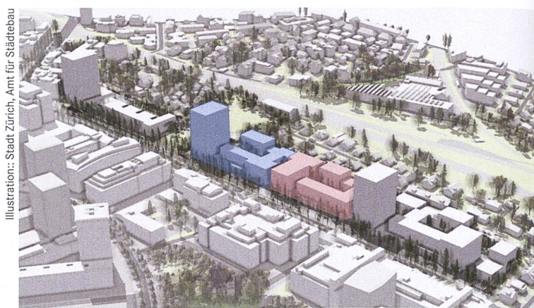
Auf dem Teilgebiet C (blau) des Areals Leutschenbach an der Thurgauerstrasse in Zürich erstellen ABZ, «mehr als wohnen» und WBG Grubenacker zusammen rund 230 Wohnungen, auf dem Teilgebiet D (rosa) die Wogeno Zürich und die Stiftung Familienwohnungen 150.

Das Thuricum-Projekt mit gut 230 Wohnungen überzeugte das Beurteilungsgremium insbesondere aufgrund seiner grossen ökologischen Nachhaltigkeit, der sozial, demografisch und ökonomisch durchmischten Mieterschaft sowie den Ansätzen zum Einbezug des benachbarten Quartiers. Meet your neighbours sieht rund 150 Wohnungen, Gewerberäume sowie vielge-