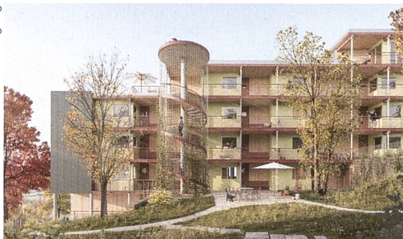
Das Projekt von Haerle Hubacher Partner Architekten sieht grosszügige Wohnungen, offene Wendeltreppen sowie Laubgänge und attraktive Aussenräume vor.