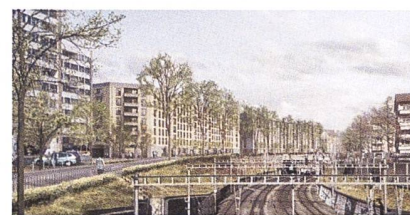
Seebahn-Höfe: mehr Wohnraum und mehr Lebensqualität im Zürcher Kreis 4.

Der Gestaltungsplan wird nach der öffentlichen Auflage bereinigt, vom Stadtrat verabschiedet und im Parlament beraten. In Kraft gesetzt werden dürfte er Ende 2024. Der Baustart erfolgt frühestens 2025. Das Projekt blickt auf eine mehr als 15 Jahre dauernde Planungsgeschichte zurück und war unter anderem wegen Rekursen des Heimatschutzes lange blockiert.