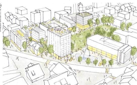
Ideenskizze zur Neugestaltung des Leepünt-Areals mit verdichteten Wohnbauten im südlichen und einem Park im nördlichen Teil.

Lägern Wohnen, Baden / Schönheim, Zürich / Gesewo, Winterthur / Brunnenhof, Zürich / BGZ, Zürich