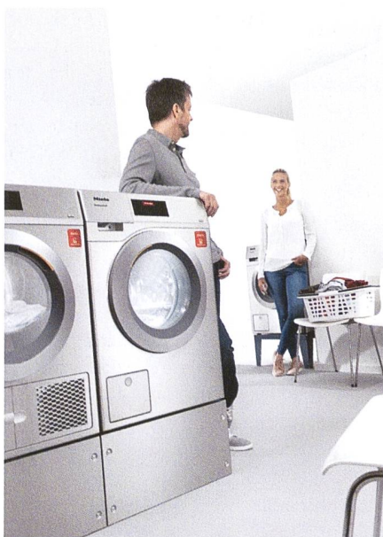
Einfach, komfortabel und aus einer Hand: die digitale All-in-One-Plattform «appWash» von Miele.

Oft ist die Wäsche noch nicht fertig, wenn man nach ihr sieht. Das ist frustrierend und ineffizient. appWash ermöglicht es, die Waschmaschine mit wenigen Klicks zu reservieren. Ein langes Warten auf eine freie Maschine gehört damit der Vergangenheit an. Denn mit appWash wird die Waschmaschine bequem über die App gestartet und man wird per SMS benachrichtigt, wenn der Waschvorgang beendet ist. Das ist vor allem in grossen Häusern mit vielen Stockwerken praktisch und spart den Bewohnerinnen und Bewohnern Zeit sowie unnötiges Treppensteigen.