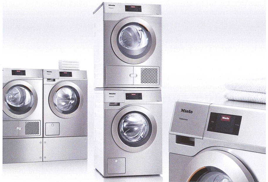
Zukunftsfähig vernetzt per WLAN, höchster Bedienkomfort mit Fulltouch-Farbdisplay, bis zu 32 Sprachen wählbar.