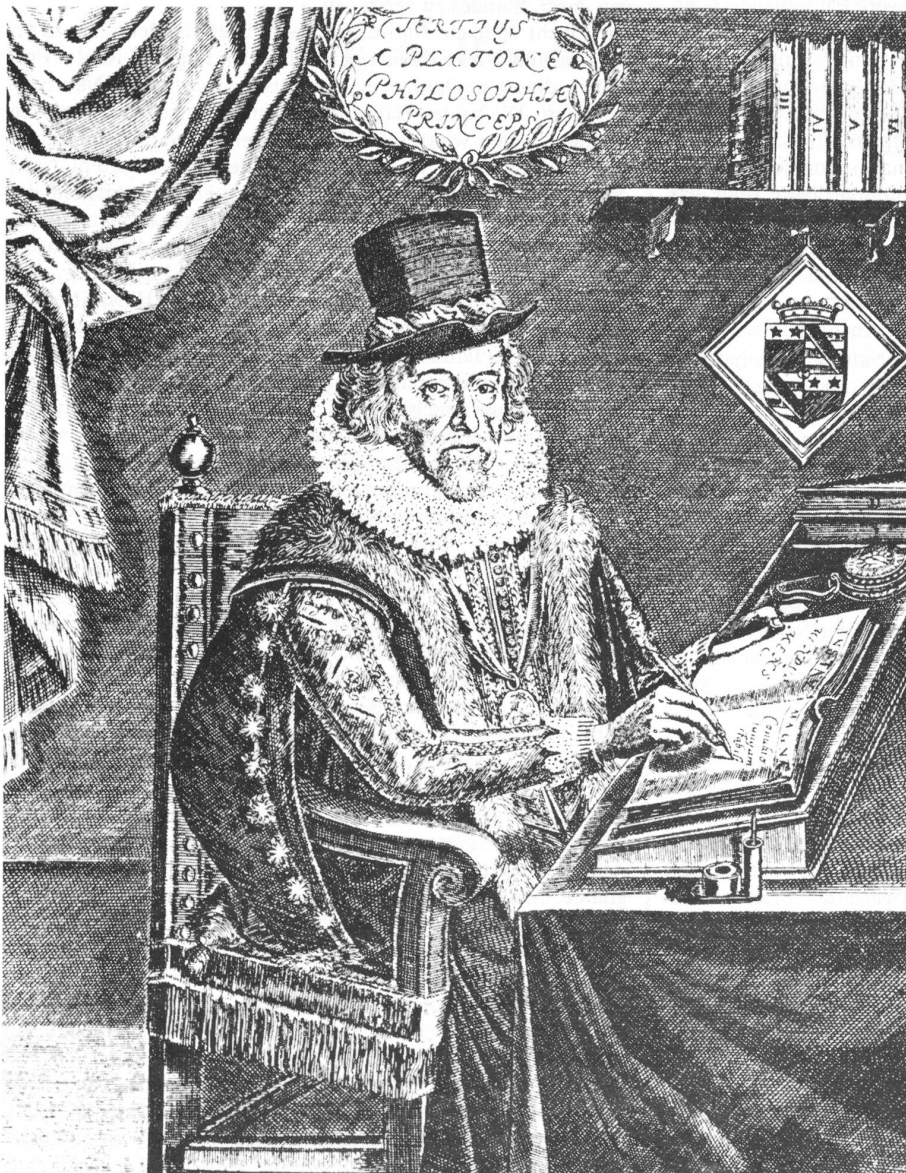
Sir Francis Bacon (1561–1626), Wissenschaftler und Staatsmann, Patriarch und Hexenjäger. Mit 23 Jahren Parlamentsabgeord- neter, nach steiler Karriere 1618 als Lordkanzler wegen passiver Bestechung gestürzt.

Interessant ist für uns, wie sehr Bacon — der zentrale Ideologe der modernen Naturwissenschaft in ihren Anfängen — Vorstellungen aus der Politik übernommen hatte, um sie auf seine